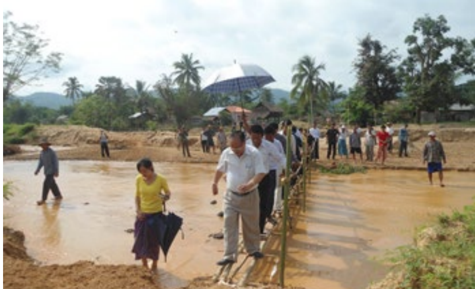
သတ္တုဝန်ကြီး စိုင်းအိုက်ပေါင်း နားဟိုင်းလုံကိုလည်ပတ်