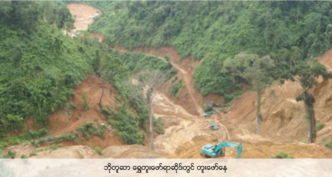
ဘိုတူဆာ ရွှေတူးဖော်ရာဆိုဒ်တွင် တူးဖော်နေ