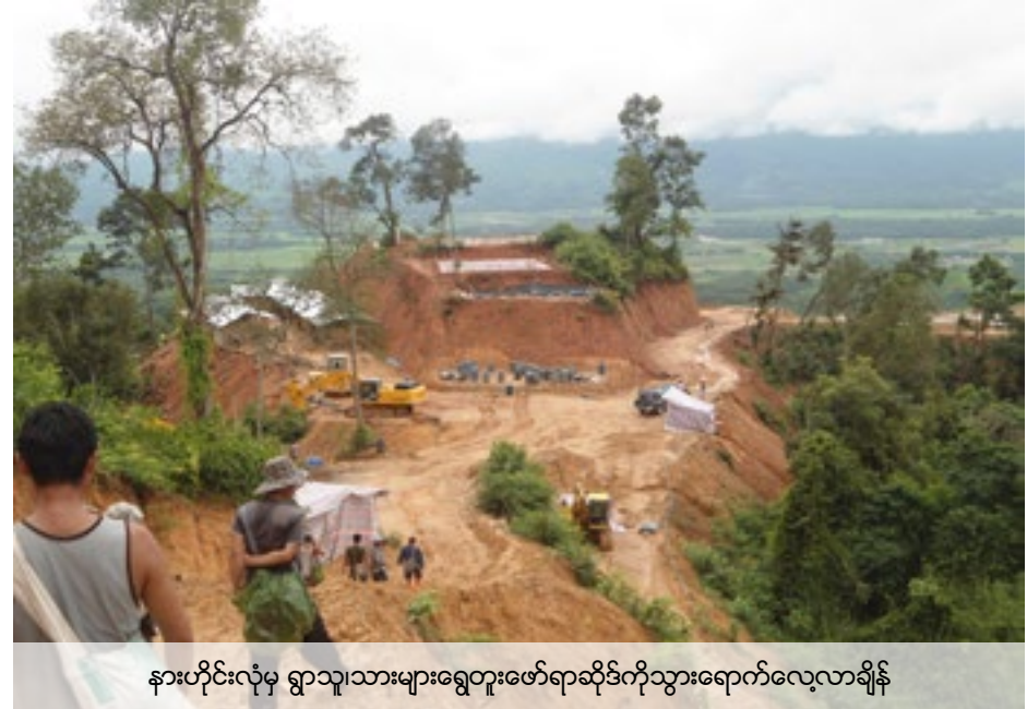
နားဟိုင်းလုံမှ ရွာသူ၊သားများရွှေတူးဖော်ရာဆိုင်ကိုသွားရောက်လေ့လာချိန်