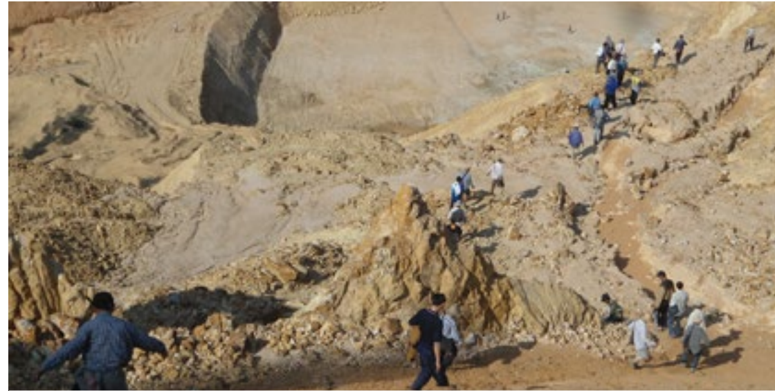
လွယ်ခမ်း(ရွှေတောင်) သို့ ရွာသူ၊ရွာသားများသွားရောက်လေ့လာ

ရွှေတူးဖော်ရေးလုပ်ငန်းရပ်တန့်စေရန်တောင်းဆိုချက်ကိုဆက်လက်လုပ်ဆောင်နိုင်ရန်တွက်ရွာသားများလွန်ခဲ့သည့်နှစ်အတွင်းလက်တွေ့ဖြစ်စဉ်များကိုမှတ်တမ်းတင်ခါသတင်းအချက်အလက်ကိုဤစာအုပ်ငယ်ကစုဆောင်းတင်ပြထားသည်။