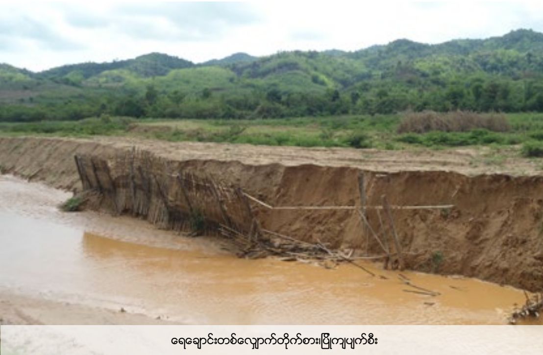
ရေချောင်းတစ်လျှောက်တိုက်စား၊ပြိုကျပျက်စီး