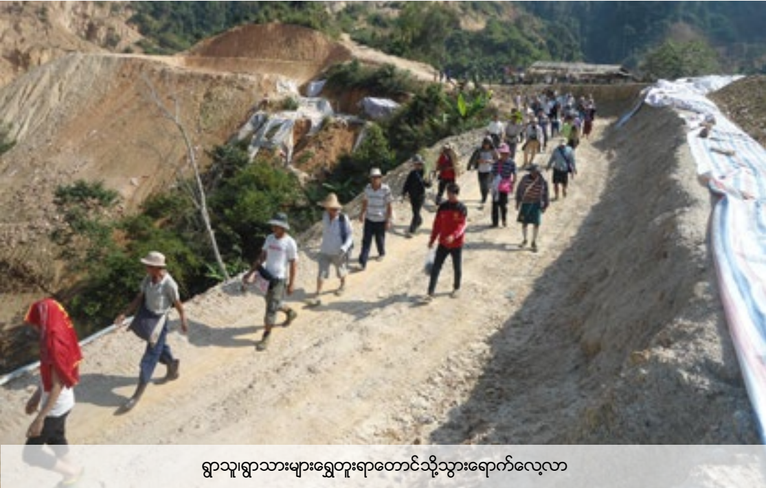
ရွာသူ၊ရွာသားများရွှေတူးရာတောင်သို့သွားရောက်လေ့လာ

၂။ ရေစီးရေလာလမ်းပြုပြင်ရေးကိုထိထိရောက်ရောက်မလုပ်ခြင်း။