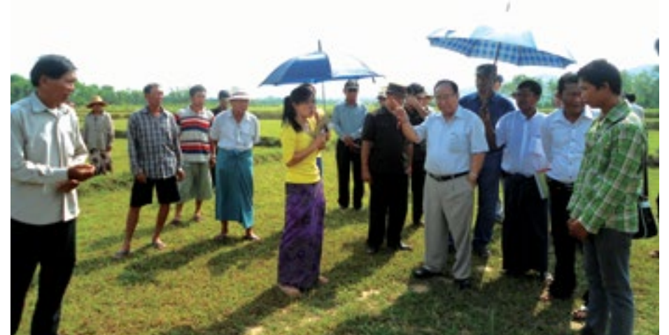
သတ္တုဝန်ကြီး စိုင်းအိုက်ပေါင်း နားဟိုင်းလုံကိုလည်ပတ်

၂၀၁၅ခုနှစ်၊ ဇန်နဝါရီလ ၂၉ ရက်နေ့တွင် ရှမ်းပြည်နယ် စိုက်ပျိုးရေး ဝန်ကြီးဖြစ်သူ စိုင်းဆာလူသည် နားဟိုင်းလုံပတ်ဝန်းကျင်ကိုလှည့်လည်ကြည့်ရှုပြီးပျက်စီးသွားသော လယ်မြေနှင့်ရေစီးကြောင်းတို့ကိုပြင်ရန်ကုမ္ပဏီတို့အားအမိန့်ပေးခဲ့သည်။ ရွာသားနှင့်ဌာနဆိုင်ရာများကိုလည်းကုမ္ပဏီတကယ် လုပ်မလုပ်စောင့်ကြည့်ရန်ကော်မတီဖွဲ့ဖို့ပြောခဲ့သည်။