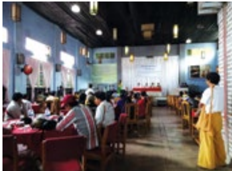
နားဟိုင်းလုံရွာသူ၊သားနှင့်ရှမ်းပြည်သတ္တဝါဝန်ကြီးအား တောင်ကြီးတွင်တွေ့ဆုံ