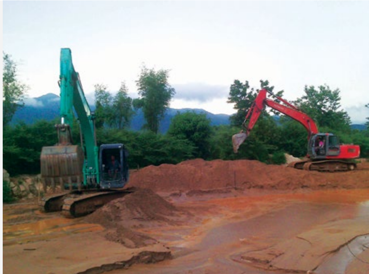
နမ့်ခမ်းချောင်း တွင်းရှိသဲနွန်းကို ကုမ္ပဏီကကုတ်ထုတ်