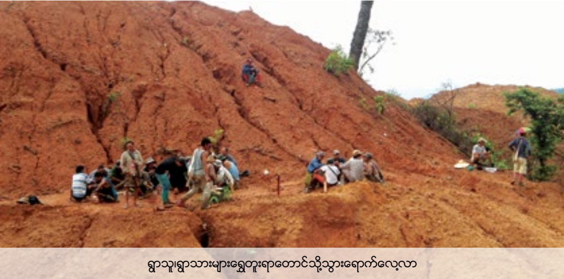
ရွာသူရွာသားများရွှေတူးရာတောင်သို့သွားရောက်လေ့လာ

တကြိမ်မှာအစိုးရအရာရှိများနှင့်အတူသွားခဲ့သည်။ ဇယားတွင်ရွှေတူးရာဒေသသို့အစိုးရအရာရှိများ၏ ၂၀၁၄ခုနှစ်အောက်တိုဘာလတွင် စစ်ဆေးမှုကိုလည်းမှတ်တမ်းတင်ထားသည်။ ရွှေတူးဖော်မှုရပ်ဆိုင်းရန်အမိန့်အားကုမ္ပဏီသုံးခုကမည်သို့တုန့်ပြန်ကြသည်ကိုရွာသားများက လေ့လာသုံးသပ်ထားခြင်းဖြစ်သည်။