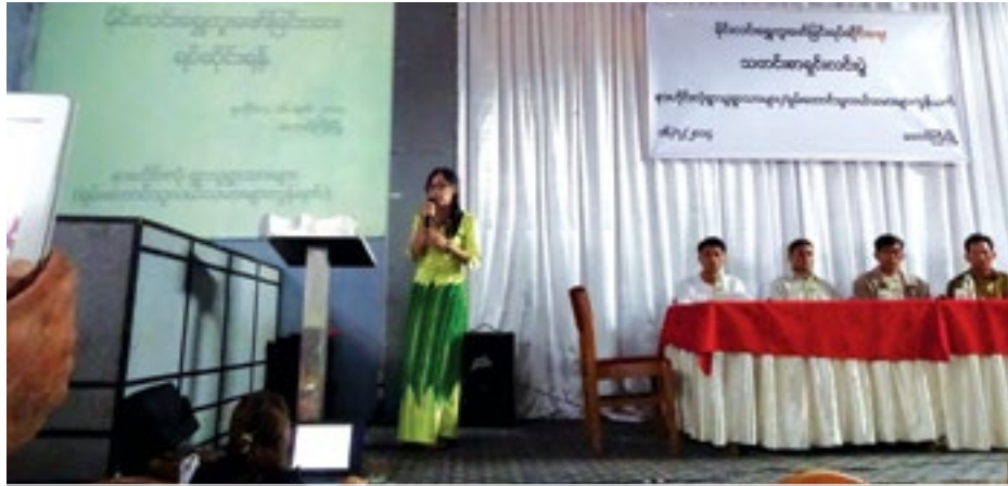
နားဟိုင်းလုံမှရွာသူ၊ရွာသားတောင်ကြီးတွင် ရွှေတူးဖော်မှုနှင့်ပတ်သက်ပြီးသတင်းစာရှင်းလင်းပွဲ