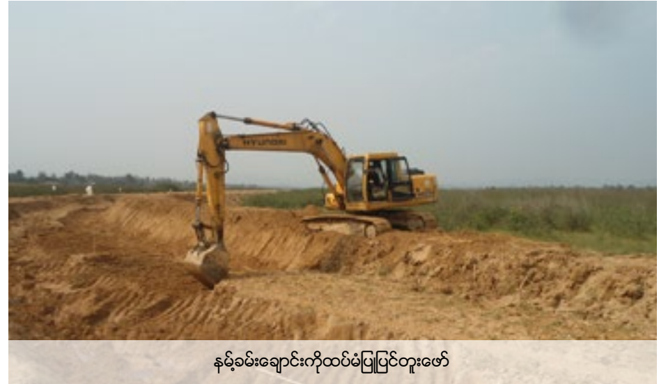
နမ့်ခမ်းချောင်းကိုထပ်မံပြုပြင်တူးဖော်

စိုင်းတစ်ကုမ္ပဏီ - စိုင်းတစ်ကုမ္ပဏီအားစောင့်ကြည့်ခြင်းအလုပ်ကို ၂၀၁၄ဩဂုတ်လ၊ စက်တင်ဘာလနှင့်နိုဝင်ဘာလအထိလုပ်ခဲ့သည်။ သန့်စင်ရေးကန်များကိုဆက်လက်အသုံးပြုနေသည်။ သို့သော် ၂၀၁၄ဒီဇင်ဘာလတွင်အလုပ်သမားများနှင့်စွမ်းကိရိယာတို့ကိုပြန်သိမ်းသွားကြသည်။ ရွှေတူးဖော်သည့်လုပ်ငန်းကိုဆက်မလုပ်တော့ပါ။