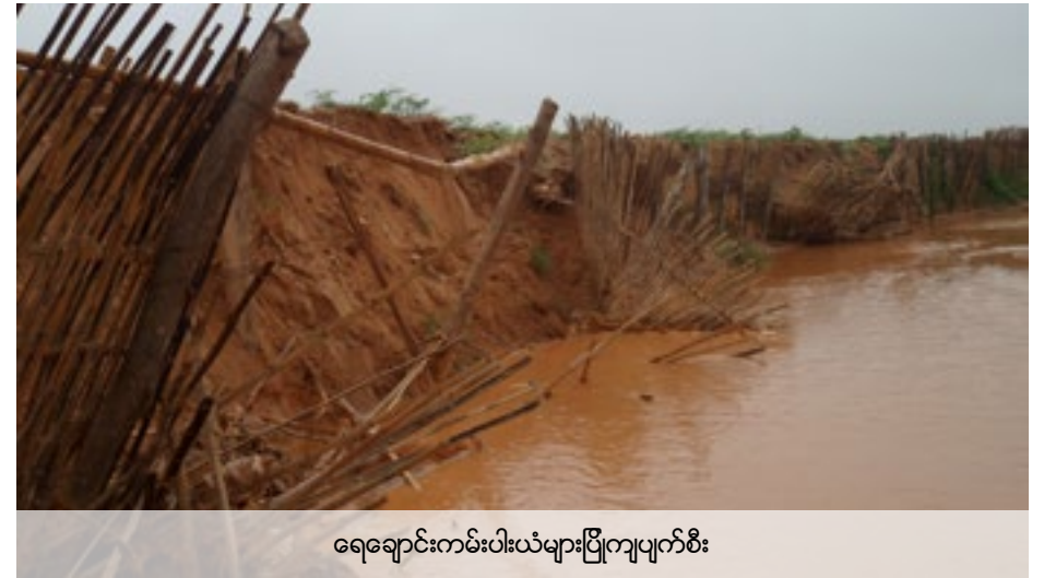
ရေချောင်းကမ်းပါးယံများပြိုကျပျက်စီး

တုန့်ပြန်ချက် - ကုမ္ပဏီတို့ကရွာနားရှိနမ့်ခမ်းချောင်းကိုခေတ္တရေကြောင်းလွှဲပြောင်းပေးခဲ့သည်။သို့သော်မိုးရွာသွန်းမှု၊မိုင်းမှစွန့်ပစ်ပစ္စည်းများထုတ်လွှတ်နေမှုတွေကရေကိုညစ်ညမ်းစေသည်။