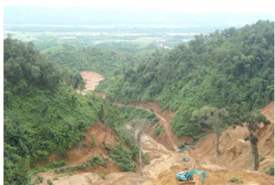
ဘိုတူဆာ ရွှေတူးဖော်ရာဆိုင်တွင် တူးဖော်နေ