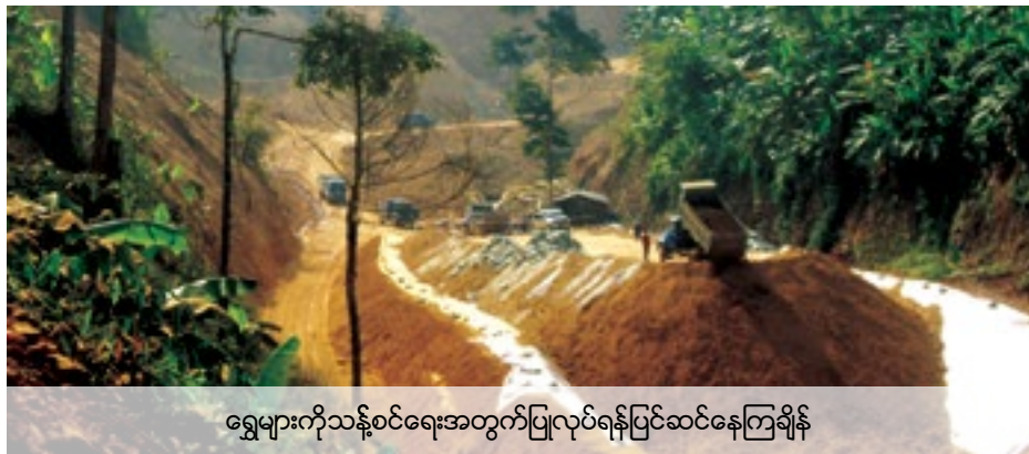
ရွှေများကိုသန့်စင်ရေးအတွက်ပြုလုပ်ရန်ပြင်ဆင်နေကြချိန်