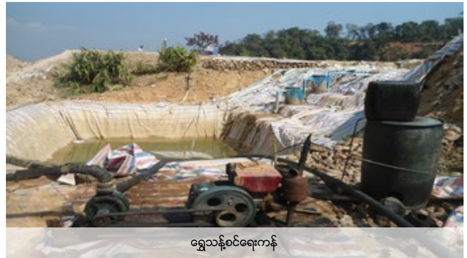
ရွှေသန့်စင်ရေးကန်

မှတ်ချက် - အောက်ပါဇယားတွင်ဖော်ပြထားသောသန့်စင်ကန်များမှာမြေကြီးထဲတွင်တွင်းတူးပြီးပလပ်စတစ်ဖျင်ဖြင့်ခံထားခါရေဖျော်ထားသောဆိုက်အာနိတ်ကိုထည့်ထားသည်။ ရလာသောမြေဇာမှ ကျောက်တုံးများကို ရွှေနှင့်ခွဲခြားရန်ဖြစ်သည်။ ထိုကန်တို့မှအဆိပ်ရေကို မစစ်တော့ဘဲ အခါအားလျှော့စွာနမ့်ခမ်း ချောင်းထဲထုတ်လွှတ်သဖြင့်အောက်ပိုင်းရှိ နားဟိုင်းလုံရွာသို့စီးဆင်းရောက်ရှိလာသည်။