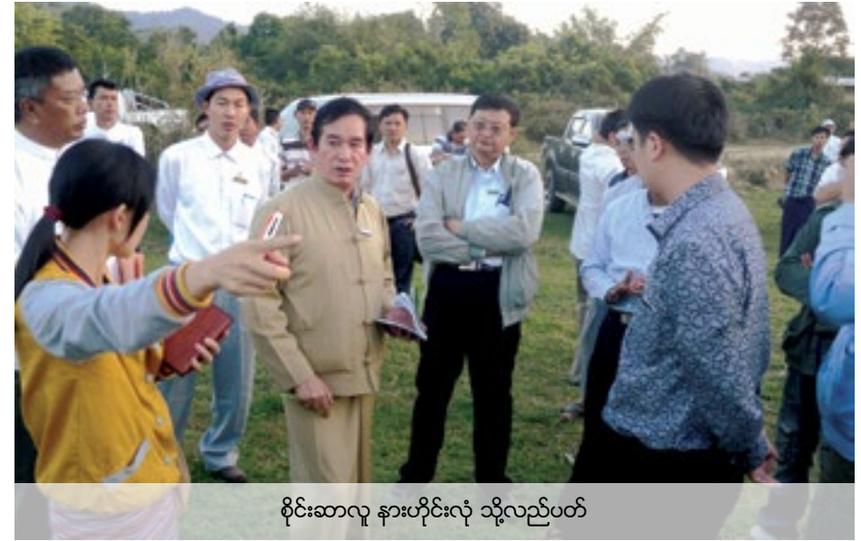
စိုင်းဆာလူ နားဟိုင်းလုံ သို့လည်ပတ်