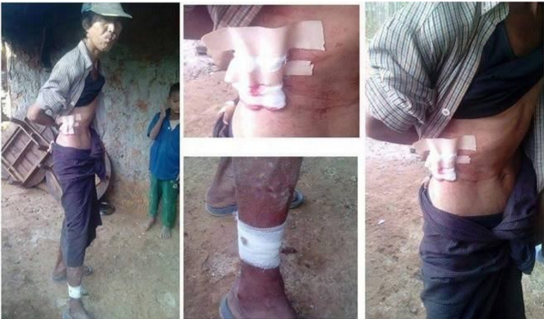
လက်နက်ကြီးငယ်ပစ်ခတ်မှုကြောင့် ကျည်ဆန်ထိမှန်သူ စိုင်းဖေ