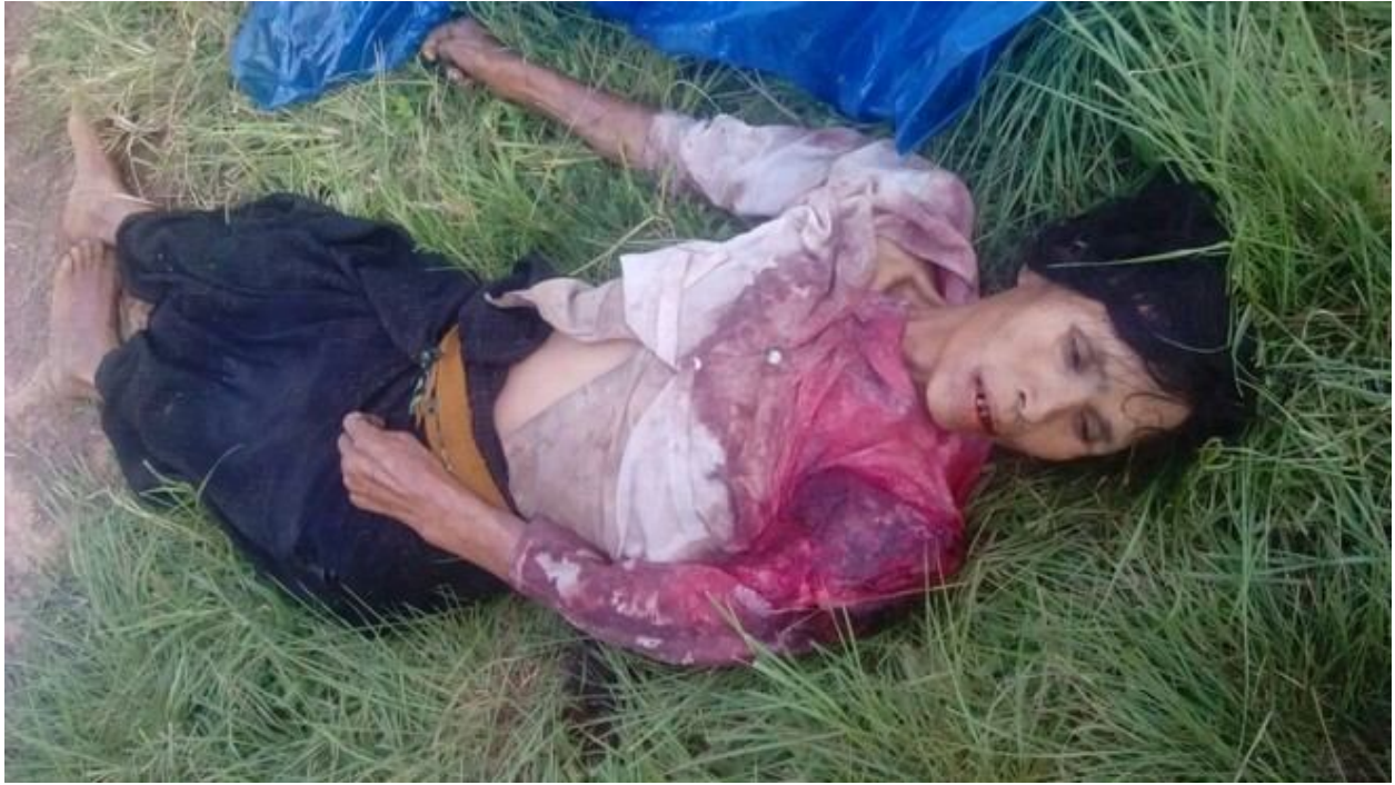
ဗမာစစ်သားမှ ပျံကြွာ အား တမင်တကာပစ်သတ်မှုကြောင့် သေဆုံးသူ ပျံကြွာ ပုံ

အဲဒီနောက်ပိုင်းတွင်ဗမာစစ်သားတို့သည်ဘုန်းကြီးကျောင်းအတွင်းသို့အခန်းတိုင်းဝင်ရောက်ခါဘီဒီနဲ့ အိတ်များ ကိုရှာဖွေမွေ့နှောက်ပြီး သေနတ်တို့ဖြင့် ထင်ရာပစ်ခတ်ကြသည်။