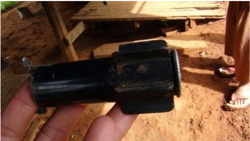
ဗမာစစ်တပ်သားမှ နောင်ပါတက်ရွာအတွင်းသို့ ပစ်ကျရာ ကျည်

ကျည်ခုနစ် လုံးသည် ရွာထဲသို့ တစ်နေရာစီ ကျခဲ့ပြီး ၆ ဦး ဒဏ်ရာရခဲ့သည်။