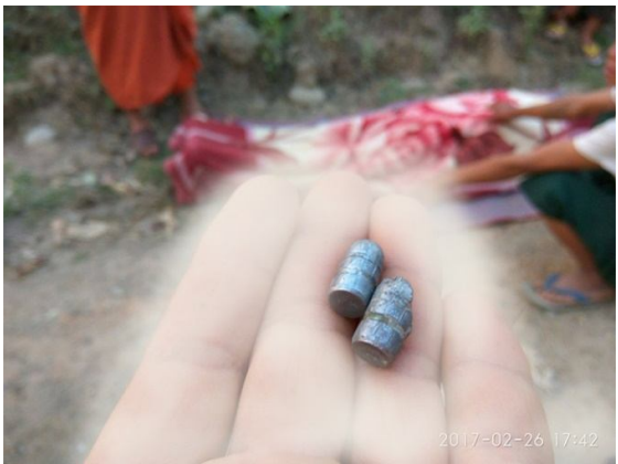
မာ်,ဂွင်းကန်ယိုင်းလင်းလါမ်,ဖေ,

ဂပ်.ငဝ်းသုခင်းလံ;ဂုခင်းလိုင်းတီးဂုင်းခး သါခင်ခတ်း လွင်းခးဂိုမ်ဗျာ.ခမ်းတူင်,ဂုင်းခင်းပိုခင်းတီး ခိ.သေ သါခင်ခတ်း လွင်းတိုက်.မီးဂါခင်းခတ်ထာခင်း,ခင်းထုင်.ခမ်းမလး ကပ်သိုင်းမားကပ်ဂုမ့်,လူမ်းထိုင်ထာခင်း, ကန်လါင်းဂိုတ်း ဂွံးသိုပ်, ပီခင်းပခင်းဂျာယုင်းယင်းဂျာ,ခင်းယင်းထိုင်းခင်းယဝ်။