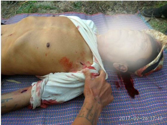
လင်းလါမ်,ဖေ, ကျယု 57

လွင်းလင်းလါမ်,ဖေ, လျးယိုင်းတံခိ. ဂိုတ်းဂွံးဂုခင်းဝါခင်းလွမ်းဂုင်ဂု သေဂိုတ်းဂွံးပီခင်းလွင်းကမ်,မ့်,မီးဗိုင်းလုံမားဂုတ်း သိုပ်,ဂုပ်.ပုခင်းဖွင်းဗျာ.ခင်းခင်းခင်းဂုလွင်းလွင်း တိုခင်းဂျာ။