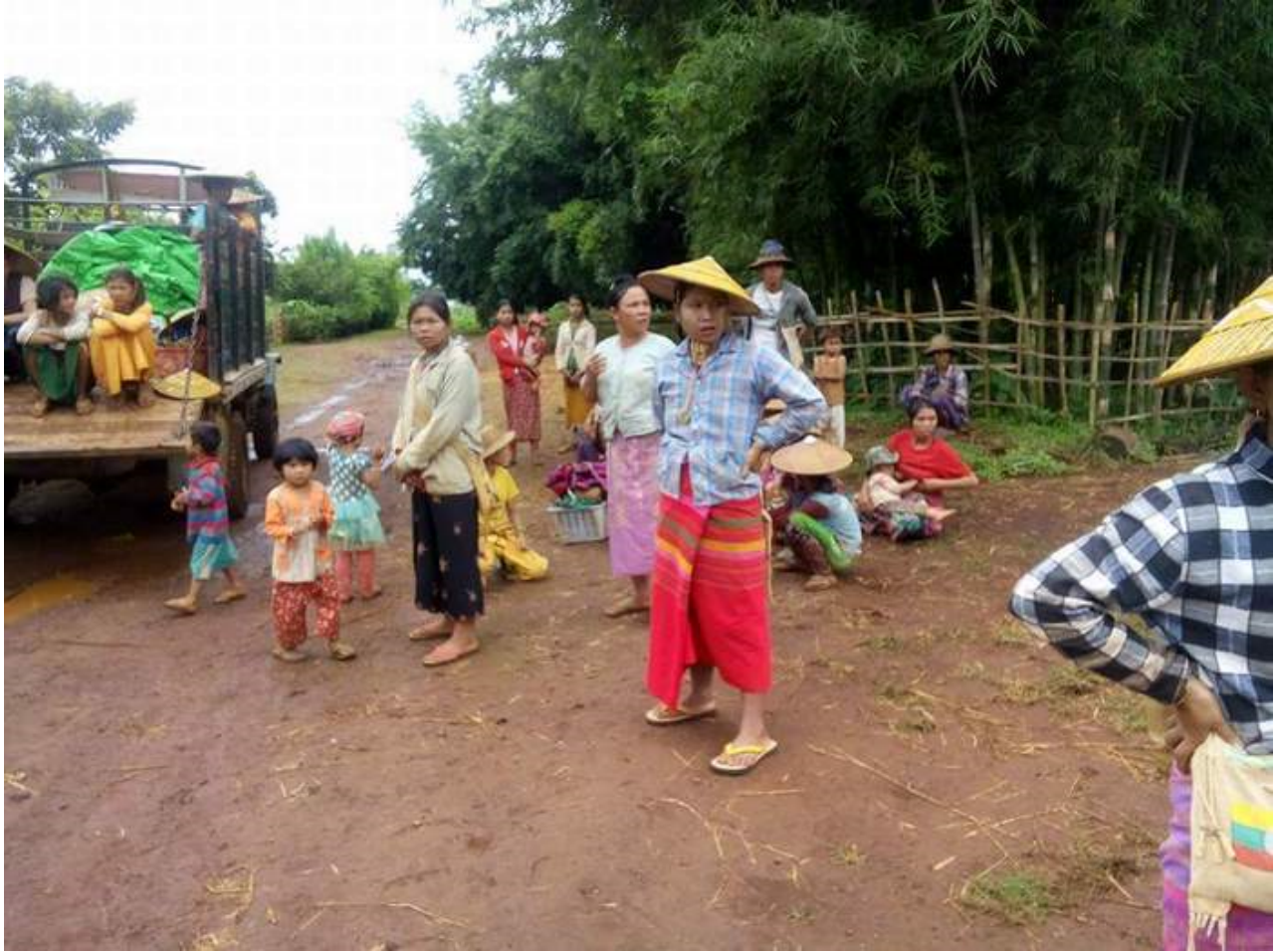
လွယ်ယွဲ မှထွက်ပြေးလာသော ရွာသားများ