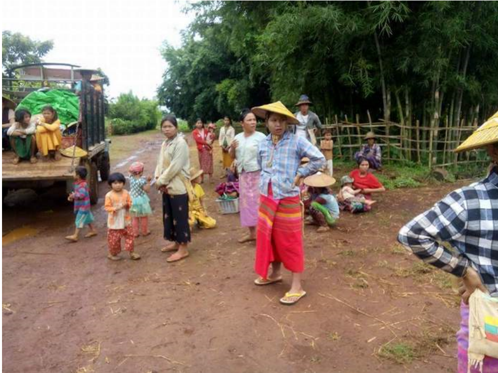
ဂုခ်းဝါခ်းဗွင်တိုခ်,သါခ်းဂခ်ပး

မိုင်းခန့်. 11/9/2017 သိုက်မာခ်းဗလရ 147 ခွင်ဂေး ဗးသိမ်, မွက်; 30 ဂေး. လုဂ်.တင်း သွင်ခေး ဗဝ်းမးတင်း ဝါခ်းဂပ်,ဂုင်းမိုတ်; (ဝါခ်းရှမ်း) ငလးဝ်းသီ,ပေး.သေ ကပ်ခွင်; ကပ်မာဂ်,လုင်ယိုဝ်း ငလးရှိုတ်းရှိုင်းဂုခ်းဝါခ်း ရှမ်းရှမ်းခေခ်.တိုခ်,သါခ်းဂုပ်ရှေ။