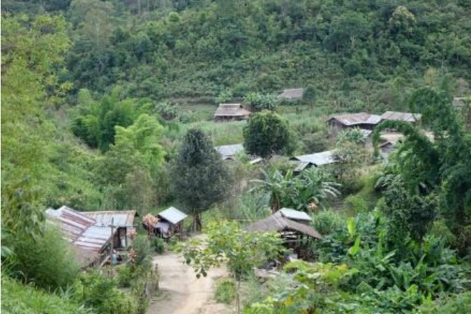
ပာင်သင်းဂူခင်းဟံးဗေးတီးလွဲလမ်

လွဲလမ်ခန့်. ပီခင်ပာင်သင်းဂူခင်းဟံးဗေးမိုင်းတံးကခင်ခိုင်; ခင်းရှုးပာင်သင်း လွမ်းလိခင်လိခင်တံး-ထံး။ ပာင်သင်း ရှုးပာင် မီးရှုတ်ဂူခင်းဟံးဗေးပိုင်;ကိုင်ယု,သင်း 6,000 ပံာ် ဂမ်းခမ်ပီခင်ခင်းယိင်းလေးလုဂ်;ကွခင်း။ လုမ်းလဝ်; တၢ,ခေၤ. ခွဂ်;မိုင်းခပ်တတ်းဂါခင်လွံးထံမ် ဂူခင်းဟံးဗေးရှုးပာင်သင်းခန့်. မိုင်းခင်းလှိုင်ခင် ကွဂ်;ထူဝ်းပိုင် 2017 ပီဂ်.သမ်.ခင်းမိုင်းတံးတိုဂ်.ပီခင်ပာင်တိုဂ်;သိုဂ်;သိုဝ်ပံ,ဂတ်းယိခင်လေး သိုဂ်;မာခင်းတိုဂ်.သိုဝ်,ထံမ်ခင်းသိုဂ်; နှိတ်းရှုး ဂူခင်းဟံးဗေးပံ,လၢင်းပွဂ်;ခိုခင်းဝါခင်းဂိုတ်,မိုင်းခင်းခင်းခေၤ.ဂေၤ; ယဝ်.။