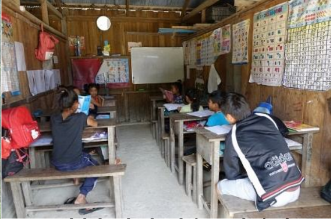
ရှုးနှိတ်း ပာင်သင်းဂူခင်းဟံးဗေးတီးလွဲလမ်