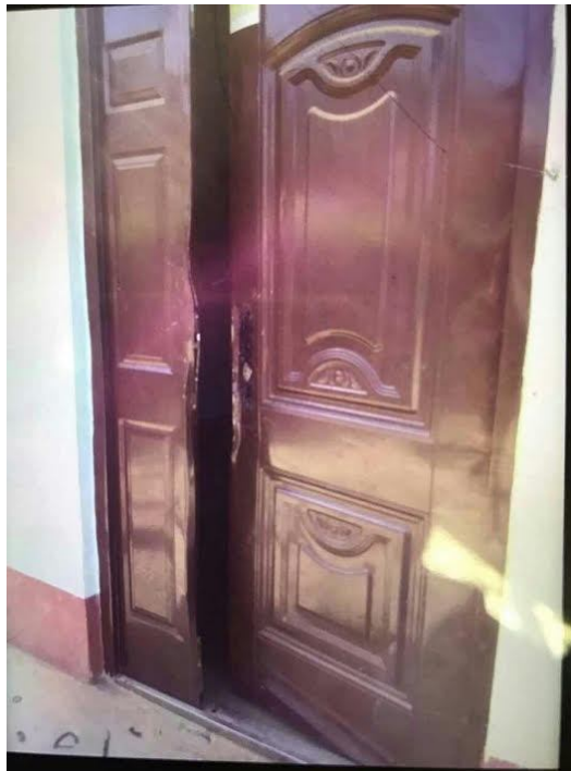
အိမ်ထဲဝင်နိုင်ရန် အတွက် တံခါးပေါက်ကိုဖျက်ဆီးထားပုံ