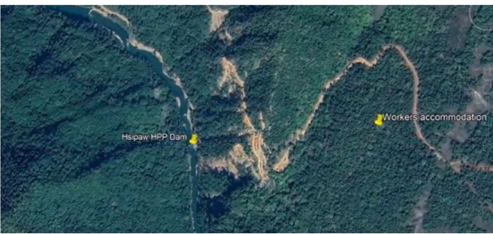
ဩဂုတ်လ 2018 ခုနှစ်ရေကာတာစီမံကိန်းနေရာ၏ Google ပုံ