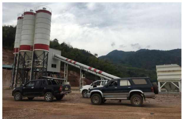
နမူတူ/သီပေါရေကာတာ ခွင့်ပြုချက်မရှိဘဲ ဆောက်လုပ်ခြင်း