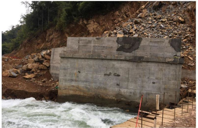
မြစ်ကမ်းဘေးတစ်လျှောက်တွင် ကွန်ကရစ်များဖြင့် တည်ဆောက်နေ