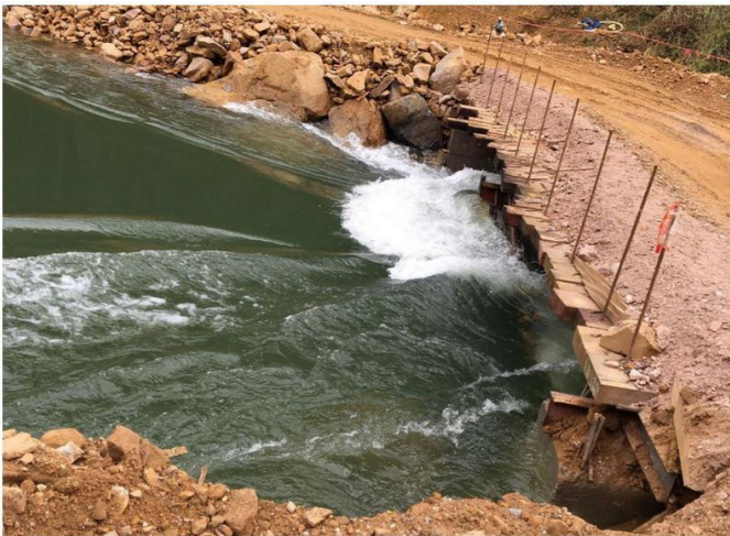
မြစ်ကိုဖြတ်ရန် ယာယီတံတား