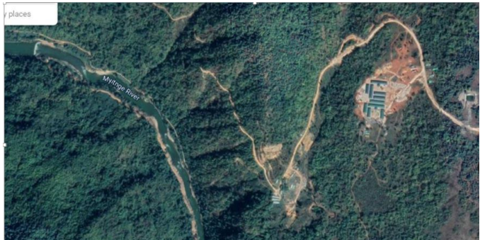
မတ်လ ၂၀၂၀ ခုနှစ် တွင်ခွင့်ပြုချက်မရှိဘဲဆောက်လုပ်ရေးကို ပြုလုပ်နေ