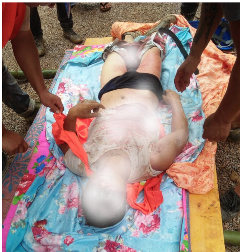
နမ္မတူဆည်အလုပ်သမား မြေပြိုမှုကြောင့်သေဆုံး

နမ္မတူရေကာတာကို ဒေသခံများပြင်းပြင်းထန်ထန်ကန့်ကွက်ကြသည်။ ရေကာတာ ၏ရေလှောင်ကန်မှာ အထက်ဖက်တွင် ၁၅ ကီလိုမီတာကျယ်ဝန်းပြီး အိမ်ခြေ ၄၇ အိမ်နှင့် လူဦးရေ ၂၁၂ ရှိသော ရှမ်းလူမျိုးတို့ နေထိုင်သည့် လီလုရွာတစ်ရွာ လုံးရေ အောက်လွှမ်းမိုးခံရမည်ဖြစ်သည်။ ဒေသခံများအနေဖြင့်နေရပ်မှ ပြောင်းရွှေ့လိုခြင်းမရှိပါ။