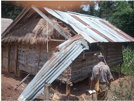
ရှိုခင်းပးသိုင် ကခင်မဂ်,သိုဂ်းမခင်းမးတိုဝ်.လုး

ခမ်းယမ်းမွဂ်; 7 မုင်းရှိုခင်းခမ်း ရှိုဝ်းမိခင်သိုဂ်းမခင်း; မိခင်မး တင်းရှိုခင်းဝါခင်းရှိုခင်းခေးသေ ပွဲ,မဂ်,လုင်း ထိုင်;မွဂ်; သိပ်းလုဂ်; လွမ်းထိုခင်း, ပး,မံ.ခခေ.။