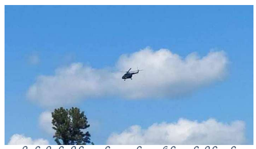
ရှိုခ်းမိခ်သိုက်မာခ်း ကခ်မးလိပ်;လွမ်းရှိုမ်းရှိုမ်း ဝါခ်းရှုတ်ခေးသေပွဲ,မာ်,လုင်း

ဓားယမ်း 11 မှုးဂင်ခွံ ထိုင် 12 မှုးဂင်ဝါခ်းတိုင်; ရှိုက် မိခ် သိုက် မာခ်းလမ်းခိုင်; မိခ်မးတါး လးသိပ်; သေ မး လွမ်း ဝါခ်းရှုတ်ခေး။ ရှိုခ်းသိုက်မာခ်းမးပွဲ,မာ်, ခွ်း ထိုခ်, ပးမိ. ယူ,တါးရှင်,ဝါခ်း; သေ ရှင်,ဂံဝါခ်းမွက်; 500 မိး တိုက်။ ဝံးခေခ်. ခိုခ်း ရှိုဂျှ,ဂိပ်.ခိုင်;ယပ်. ဝံးခေခ်. မွက်; 10 ခေးထီးခိုခ်း လံးရှခ်မိခ်မးတီးကွင်;ဂပ်, ခေခ်. သေ ပွဲ, မာ်,မွက်;သိပ်းလုက်;။