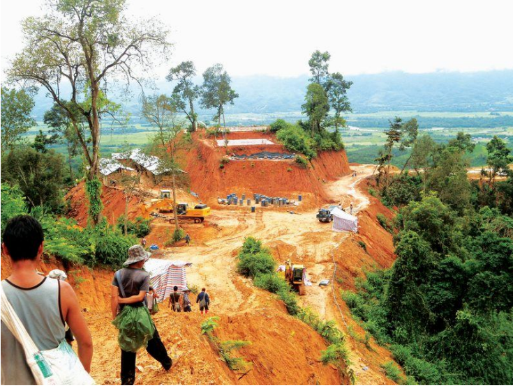
လုက်လွဲမမ်းလုက္ခံ ယွခင်.ဂါခင်ခုတ်မမ်း ခင်းငလးတွခင်းတူးဖီးလိက် လိုင်းတံးပွတ်းကွက်,