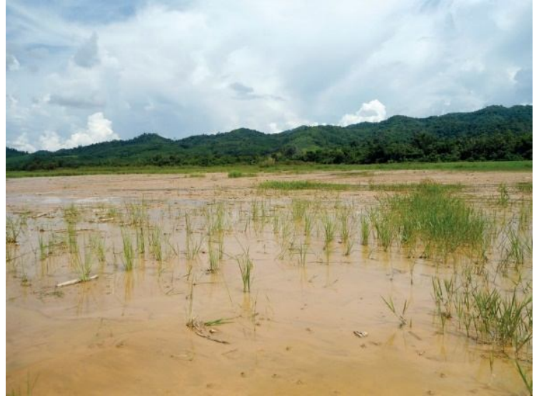
ခေးရှခင်းမိုင်းညူးနုလ်ဖီးလိခင်ခုတ်မမ်းထုမ်သု့,လုက္ခံ ကမ်,လင်; ဗနုက်,သွမ်း ရှမ်းဝါခင်းခေးရှလူင်.ဂါခင်,ငလးဝိုင်းတူးလို့ဝ်, ငလးတွခင်းတူးဖီးလိက် လိုင်းတံးပွတ်းကွက်,