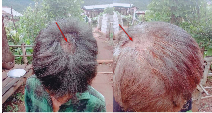
မြန်မာစစ်အစိုးရတပ်မှ ရိုက်နှပ်ခြင်းခံရသည့် လုံစံရွာသား