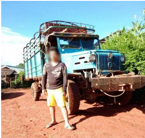
မြန်မာစစ်အစိုးရတပ်မှ ချောဆွဲခြင်းခံရသည့် ထော်လာဂျီပိုင်ရှင်

တောင်း ဒေသအတွင်း လှုပ်ရှားမှုကိုထောက်လှမ်းဖို့ RCSS က ပို့လိုက်သည့် ရွာသား ၃-ယောက်ကိုဖမ်းထားကြောင်း၊ ကိုဗစ်-19 ကပ်ရောဂါကာလအတွင်း ရန်လိုရန်စမှုမျိုး RCSS က လုပ်ဆောင်တာဖြစ်ကြောင်း ပါရှိသည်။ ဤမဟာဗျူဟာကျ လွှင်တောင်းတောင်ကုန်းကို တနိုင်လုံးပစ်ခတ်ရပ် စဲရေးစာချုပ် (NCA) ချုပ်ဆိုထား သည့် RCSS/SSA ထံမှ အစိုးရစစ်တပ်က မတ်လ အစောပိုင်းတွင် စစ်ဆင်ရေးကြီးတခုအပြီး သိမ်းယူထား ခြင်းဖြစ်သည်။ ထိုအချိန်မှစ၍ မကြာခဏဆိုသလို တပ်စခန်းသစ် တည်ဆောက်ရန်အတွက် စစ်သုံးပစ္စည်းများ၊ ဝါးပိုးဝါးများ၊ သစ်တုံးများကို တောင်ကုန်းပေါ်သို့ သည်ဆောင်ပေးရန် ရွာသားများအား အတင်း အကြပ် စေခိုင်းမှုများ ဖြစ်ပေါ်ခဲ့သည်။