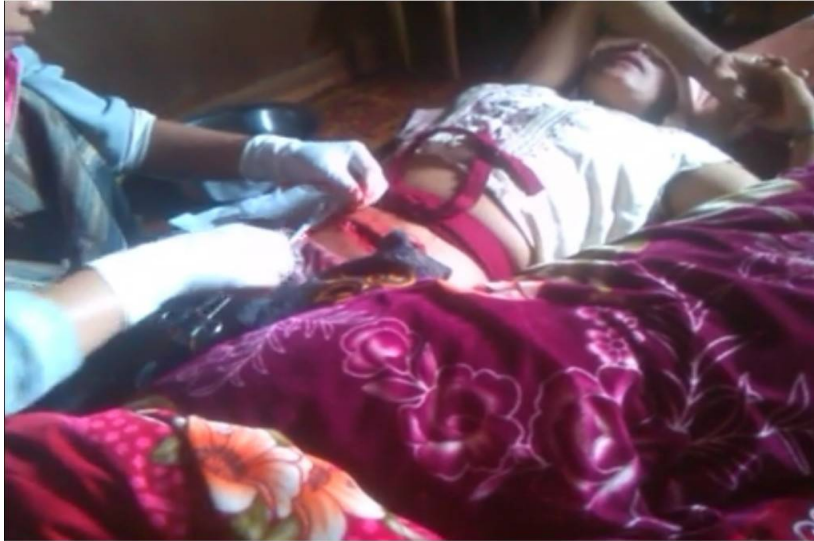
ဒေသခံသူနာပြုမှ ပါဆိုင်(ဒေါ်ဆိုင်) ၏ဝမ်းဗိုက်ထဲမှအမြောက်ဆံစ ကိုထုတ်

ဗမာစစ်တပ် နှင့်အစိုးရဘက်မှ မည်သူ တစ်ဦးတစ်ယောက်မှ ဗုံးအမြောက်ပစ်ခတ်မှု ဖြစ်စဉ်အားလုံးအပေါ် လာရောက်စစ်ဆေးခြင်း တာဝန်ယူဆောင်ရွက်ခြင်းမရှိခဲ့ပါ။(ခလရ) ၂၄၉ နှင့် (ခလရ) ၅၁၃တို့မှာခြေလျှင်တပ်တပ်မ(၅၅)၏လက်အောက်ဖြစ်ပြီးရှမ်းပြည်တောင်ပိုင်းကလောတွင်အခြေစိုက်ထားသည် ။