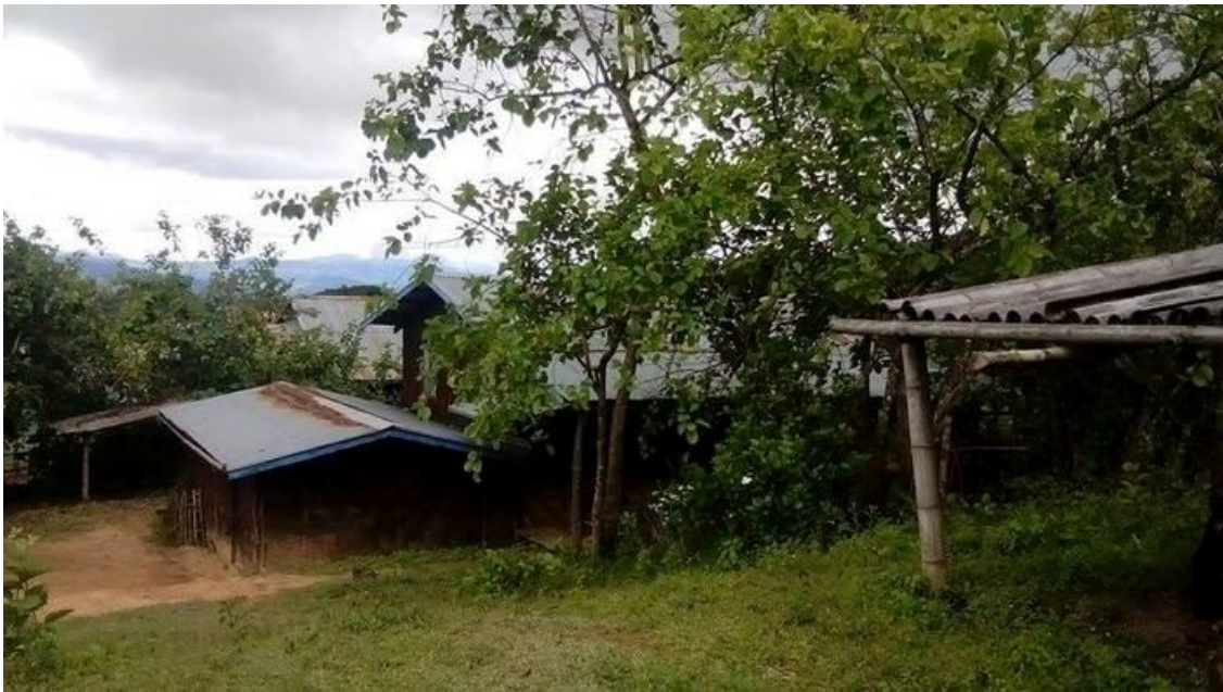
ဝမ်ကောင်းယောကျေးရွာ

စိုင်းသိန်းထွန်းနေထိုင်သော ဝမ်ကောင်းယောရွာသည် မိုင်းပွန်တောင်ဘက် ၁၂ မိုင်အကွာရှိပြီး နောင်ပါတက်ရွာ၏မြောက်ဘက် ၁၄ မိုင်လောက်အကွာဝေးရှိသည်။ စက်တင်ဘာလ ၁၂ ရက်နေ့ ၂၀၁၅ က ရွာသူရွာသားများအပေါ် အစိုးရစစ်ကြောင်းမှ လက်နက်ကြီးဖြင့်ပစ်ခတ်ခဲ့မှုအကြောင်းကို ( http://www.shanhumanrights.org/burmese/index.php/news-updates/187-2015-09-28-08-37-53 ) တွင်ဝင်ရောက်ကြည့်ရှုနိုင်ပါသည်။