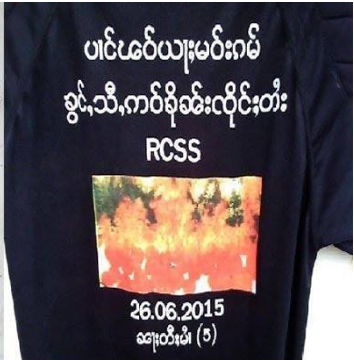
Back of T-shirt

စိုင်းသိန်းထွန်းဝတ်ဆင်သော မူးယစ်ဆေးဝါးရှင်းလင်းတိုက်ဖျက်ရေး တီရှပ်