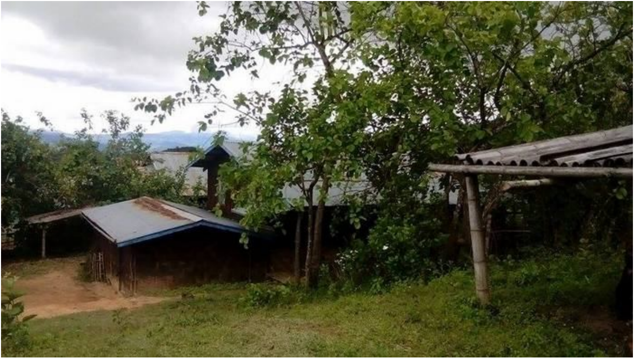
ဝါခင်းရွင်းယာဝ်း