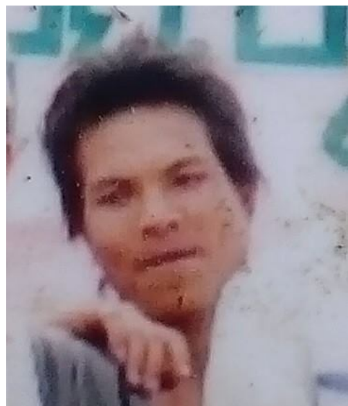
ထံးတိုင်းထုခင်း

ဂူခင်းဝခင်းဂွင်းယာဝ်း ငလးဝိုင်းမိုင်းပွခင်းတိုင်းပွတ်းလခင်း တခင်း, လိဂ်း မိုင်းဝခင်းထိ 05/10/2015 ထိုင်ဟူ; ဂွခင်းတပ်.သိုဂ်းမခင်းဆိုးပိုခင်းတီ; ငလးလဝ်းဆးတီ; ပလိဂ်း(ငယး)ခပ် သေတုဂ်းယွခင်းဂ်းပွဲ, ပခင်ဂူခင်း ဝခင်း လံးတိုင်းထုခင်း ဂေ့.လံးထုဂ်, သိုဂ်းမခင်းပေ့.ထုပ. တီလွပံးလူဂ်းကမ်, မီးလွင်းတခင်းသင်သေတီဂ်းဂွင်. ကပ်ဂျ, ဆိုး လိုခင်းသိပ်းထိပ်းပိုင်းထုခင်းမး။