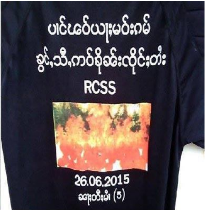
Back of T-shirt

သိုဝ်း;ဖခါ,ဖခိတ်;မူလ်.ယုးမဝ်းဂမ်ကခင်းလံးတိုင်းထုခင်းခင်း