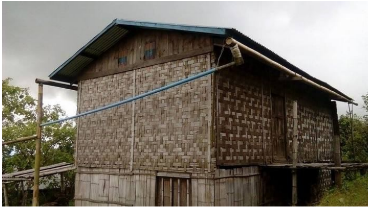
ဂူခင်းလီးတိုင်းထုခင်းခပ်

ဂူခင်းဝါခင်းဂွင်းယာဝ်းဂေးခိုင်းလာတ်းဝး “လီးတိုင်းထုခင်းခိ။ ပိခမ်ဂူခင်းလီ မေးမီးခမ်။ လုံလွမ်းလုံပိုခင်း။ မခင်း ပိခမ်ဂူခင်းဝါခင်း ထမ်း မတး (ယုဝ်းယုဝ်း) လိုင်ဂုဝ်းခပ်ဂုလ်း။ လွင်း ဝး မခင်းကမ်၊လီးမီးလွင်း ဂိဝ်းခွင်းလွမ်း လုမ်း လုံခိခမ်ဂုဝ်းဂုဝ်းပဂ်၊ ယွမ်းဂုဝ်းလီး” ခိ ယဝ်။