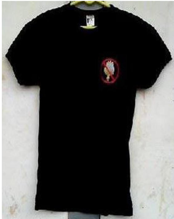
Front of T-shirt

ဖားတူင်, (လူင်,ဂျီ,) လံးတိုင်းထုခင်းလေးသွင်းတိခင်းမခင်းလံးတေးလံးဂုခင်းကပ်ပိတ်;ဝံ.ပုးခေးဂျီခင်း လုင်းဂိုင် ဆခင်းယဝ်။ မခင်းလံးခင်းဝံ.သိုဝ်း;ဖခါ,ဖခိတ်;မူလ်.ယုးမဝ်းဂမ် ကခင်းပုးမိတ်;မံခွင်,သီ, ကပ်ခိုခင်း လိုင်းတီး/ တပ်. သိုဝ်းလိုင်းတီး RCSS/SSA သေဂူခင်းဝါခင်းခပ်တေးလွမ်ထိုင်,ဝုး လွင်းခိ.ခေးလိုင်;ပိခင်းလွင်း; ကခင်းသိုဝ်း မခင်း; ခပ် ထိုင်,ထိုမ်ဝုးမခင်းလံးဂိတ်,ခွင်းလွမ်းသိုဝ်းတီးခိဆခင်းယဝ်. ခိ။