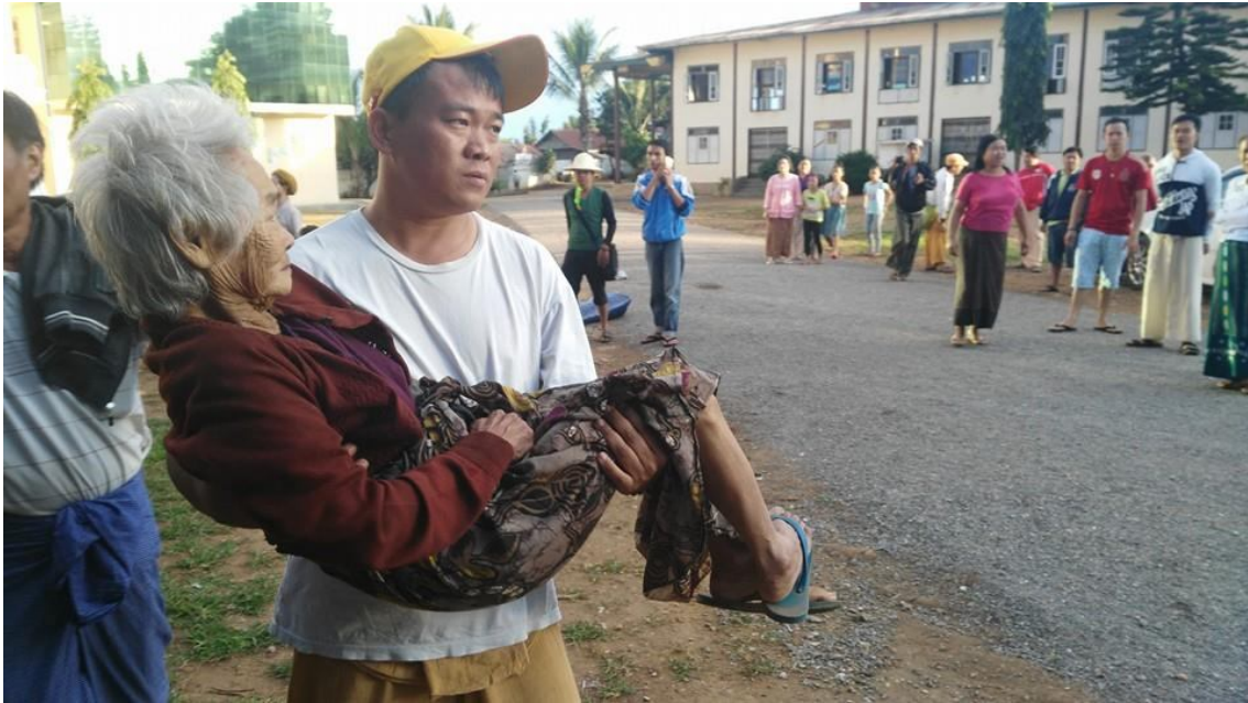
မုဝ်ငးဝေ့နော့အမိးသိမီးအုဝ်ဖုကီး လဲခါးသုဝ်၊ ကြကုဝေ့ပးတိမုးဝေ့ရွာရွာလဲးဝ်

နိုဝင်ဘာလ ၁၂ ရက်နေ့ညတွင် အစိုးရတပ်ကမိုင်းနောင်မြို့ကိုညမထွက်ရအမိန့်ထုတ်လိုက်သည်။ ဒေသလူထုများအိမ်မှထွက်ခွါခြင်းကိုတားမြစ်လိုက်သည်။ ရှမ်းစစ်သားများကမြို့လာတိုက်လိမ့်မည် ဟုသတိပေးသည်။ မြို့မှ ထွက်ခွါခြင်းကိုလည်းတားမြစ်သည်။ ဖုန်းလိုင်းများကိုလည်း ဖြတ်တောက် လိုက်သည်။ လယ်ရိတ်သိမ်းချိန်ဖြစ်နေသော်လည်းလယ်သမားများကိုလည်းမြို့ပြင်ရှိလယ်မှာစပါး များကိုရိတ်သိမ်းခွင့် မပြုချေ။