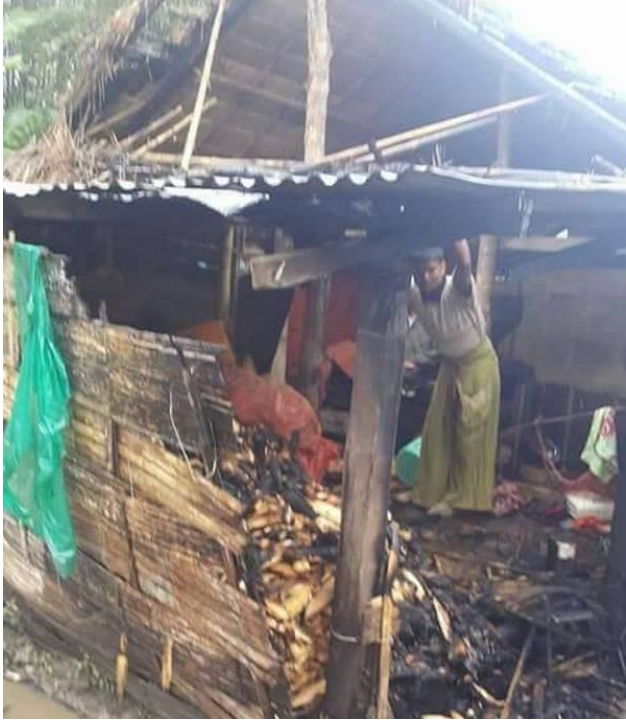
လက်ကိုင်ဖုန်းပုံရိပ်ပေးထားသော အိမ်အတွင်းတွင် အိမ်အတွင်း အိမ်ကိုင်ဖုန်းပုံရိပ်