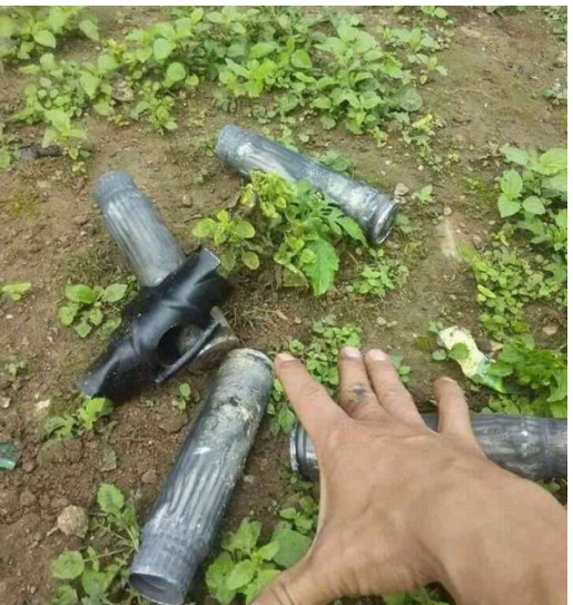
နိုဝင်ဘာလ ၁၀ ရက်နေ့ ၂၀၁၅ ခုနှစ် တွင် ရဟတ်ယာဉ်မှ မိုင်းခွေးအမျိုးမျိုး ပစ်ခတ်