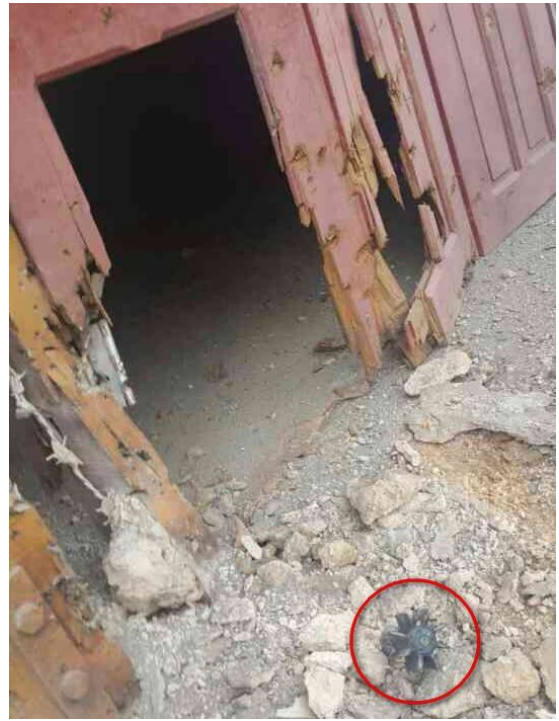
လက်ကိုင်ဖုန်းပုံရိပ်ပေးထားသော အိမ်အတွင်းတွင် အိမ်ကိုင်ဖုန်းပုံရိပ်

ဒေသခံအရပ်သားများကိုထိန်းသိမ်းပြီးရှမ်းစစ်သားများဘယ်မှာရှိသည်ကိုစစ်မေးသည်။ နိုဝင်ဘာ (၁၀)ရက်မွန်းတည့်အချိန်တွင်အသုဘအခန်းအနားမှပြန်လာသောလုံးကြာညွန့်ကိုသူ့အိမ်အပြင်တွင် အစိုးရစစ်သား ၅၀ တို့ကဖမ်းဆီးသည်။ ၎င်းနှင့် အတူတခြားလူနှစ်ယောက်တို့ကိုဖမ်းခါ မြို့အနောက်ဖက် တပ်ရင်း (၂၈၆) ရှိရာသို့ ခေါ်သွားသည်။ သူတို့ကို ရှမ်းစစ်သားများ ကိုပုဂံထားသလားဟု တနာရီကြာမှ စစ်မေးသည်။နောက်မှ လွှတ်ပေးလိုက်သည်။