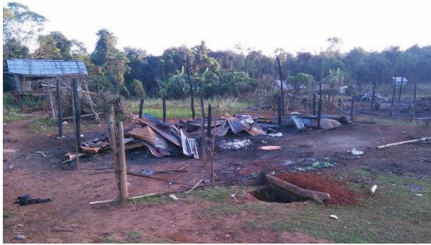
ပန်ကန်းရွာ ကို ဗမာစစ်အစိုးရကမ်းရှို့ဖျက်ဆီး