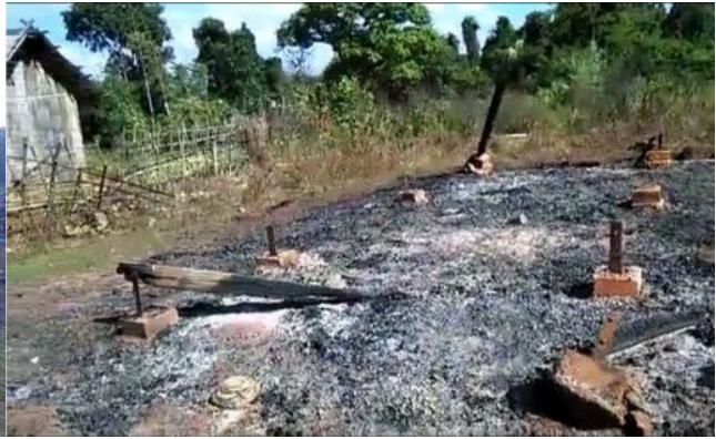
ဗမာအစိုးရစစ်သားများရွာတွင်းရှိ ရွာသူကြီးအိမ် လုံးစံအိမ်ကိုမီးရှို့ဖျက်ဆီး

နိုဝင်ဘာလ ၁၅ ရက်နေ့ တွင် ရွာအနီးတွင် ဗမာစစ်အစိုးရစစ်တပ်နှင့် တအာန်း(TNLA) တို့ အပြင်း အထန်ထပ်မံ တိုက်ပွဲဖြစ်ခဲ့သည်။