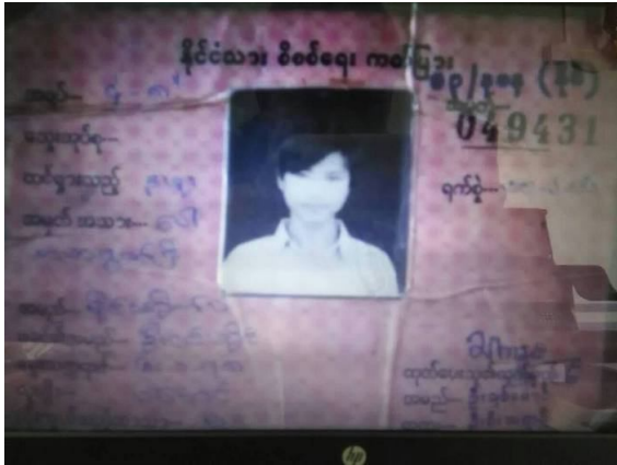
မိုင်အိုက်လှ မှတ်ပုံတင် ကဒ်ပြား