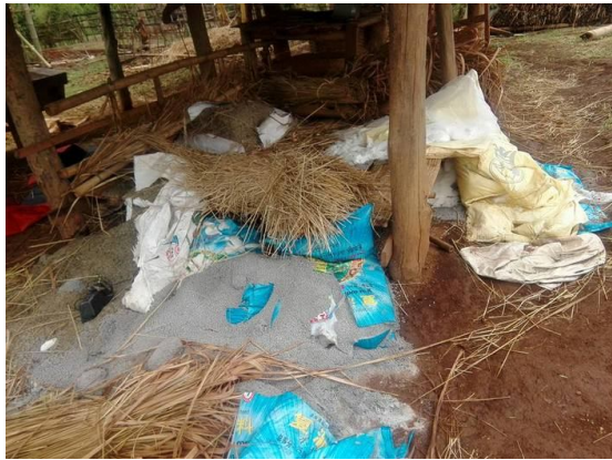
ဝိုးလုံ ကျေးရွာအိမ်ရှိ စပါးမျိုးစေ့ နှင့် မြေဩဇာအိတ် မြေဩဇာအိတ်အား သွန်မှောက်ဖျက်စီးခြင်း

မေ ၁၄၊ ၂၀၁၆ တွင် အိမ်ခြေ ၄၀ ရှိ တဲ့ နမ့်ဖတ်ရွာ ကို ဗမာ့ အစိုးရတပ်မတော် မှတစ်အိမ် ပြီးတစ်အိမ် တံခါးပေါက်များ ကိုဖျက်ဆီး ခြင်း ၊ စားနပ်ရိက္ခာ နှင့် စိုက်ပျိုးရန် မျိုးစေ့ အိတ်များ ကိုဖောက် ဖျက်ဆီး ခြင်း၊ မြေဩဇာ အိတ်များ ကို ဖျက်ဆီးပြီး မြေ မြေကြီး ပေါ် ပြန့် ကျသွား သည် အထိ ရစရာ မရှိအောင် အားလုံးဖျက်ဆီးပစ် ထားသည်။