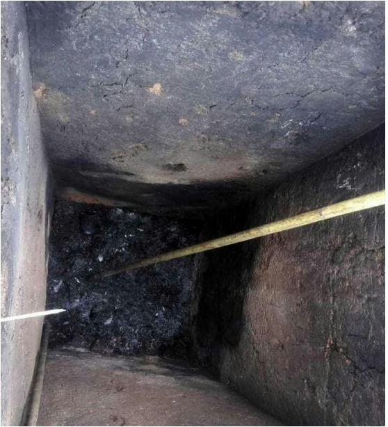
ဝိုးလုံကျေးရွာ အိမ်သာကျင်းထဲမှ အမည်မသိ ရွာ ရွာသား ၂ ယောက်၏အလောင်း

လုံးထွန်းအောင် ၏ အိမ်အနောက်ဘက်တွင် ရှိသောအိမ်သာကျင်းထဲတွင် သေဆုံးသူ ၂ ယောက်ကိုတွေ့ရှိသည်။