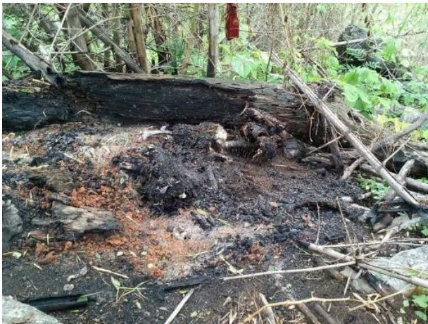
နောင်ကွမ်ကျေးရွာမှ ရွာသား ၃ ဦး၏ ကြွင်းကျန်အလောင်း