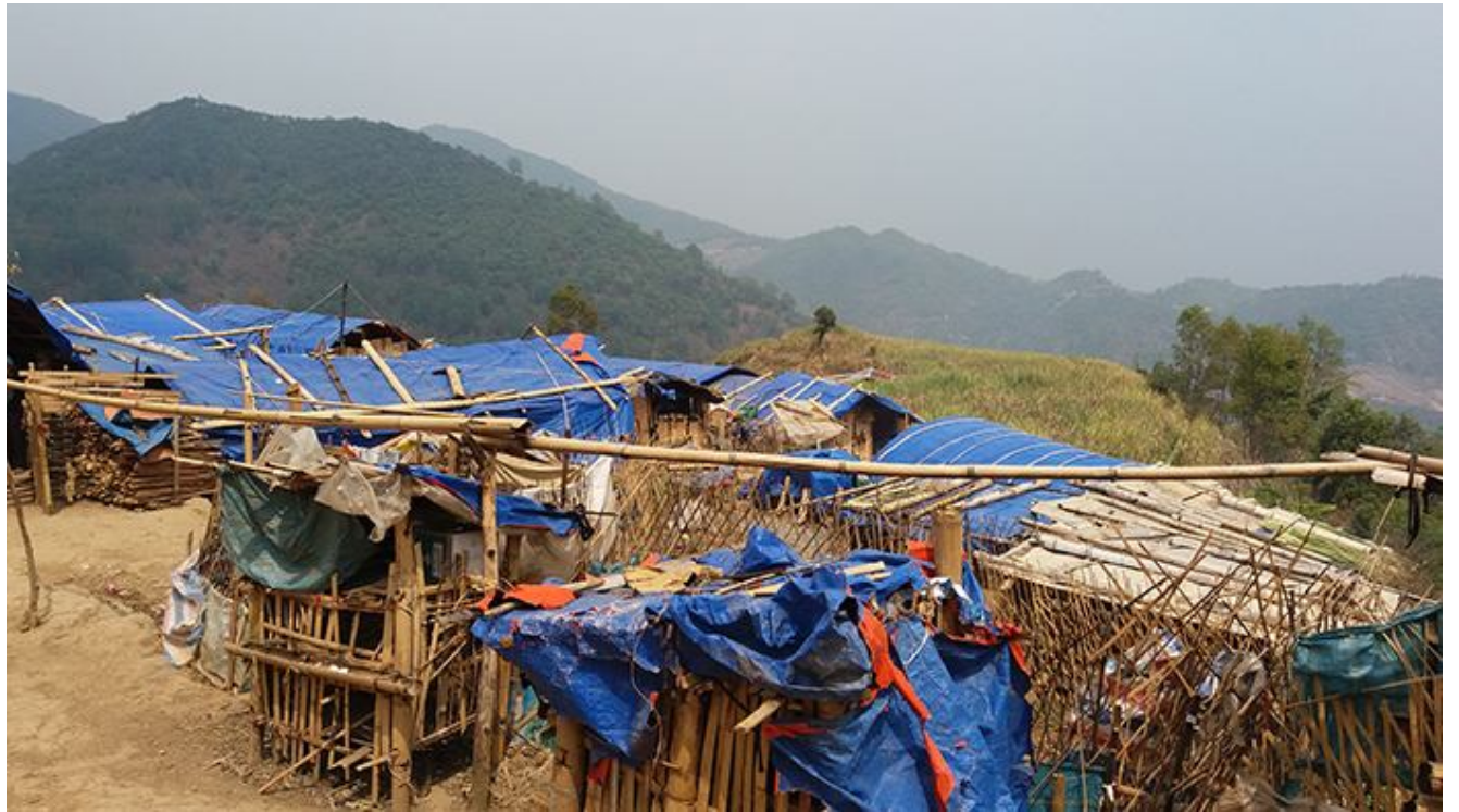
သုမ်.ပၢၣ်သၢၣ်းဂုၤဆိၣ်းပံးလှ်းလှ်းခၢၣ်း

လွင်ၤယၢၣ်,ဃိတ်,ဂပ်.ဂိၣ်းလှ်ဂုၤဆိၣ်းခး ဂးဆိၣ်းတ.ပိၣ်းလွင်ၤခပ်ဆိၣ်း.တၢၢ်ဂိၣ်းယဝ်။ ဂုၤဆိၣ်းယၢၣ်းလိၣ်းခပ်ဆိၣ်း.ကမ်တီးပိုၣ်း လှ်း ထိမ်မးယု, ဂုၤလှ်းဂးဂုၤဆိၣ်းမီးသင်တၢၢ်,ခၢၣ်းတၢၢ် 2 လှ်းယဝ်။ ဂုၤဆိၣ်းလိၣ်းဂုၤတၢၢ်ယု,လွတ်; ဂုၤဂၢၢ်းတၢၢ်သေ ဂျိတ်ဂုၤ လိၣ်.တွင်.ဂုၤဆိၣ်းဂုၤလှ်း! ဂုၤလှ်းဂး ဂးဆိၣ်းသမ်.ဂမ်ဆိၣ်းပိၣ်းလှ်းကွမ်,လးဂုၤဆိၣ်းထပ်; ကမ်ယု,ဆိၣ်းပၢၣ်သၢၣ်းဆိၣ်းသေ လှ်းခပ် ကမ်,လၢၣ်းဂျိတ်ဂၢၢ်း။ ဂုၤဆိၣ်းလိၣ်းဂုၤ,ဂုၤဃိၣ်းယိုဝ်းဆၢၣ်းခိၣ် လွမ်ဂုၤလှ်းလှ်းကမ်ယု,ဂုၤမးဂုၤဆိၣ်း.သေ ဂိၣ်းလိၣ်.သၢၣ်းလှ်းဂုၤလှ်း။