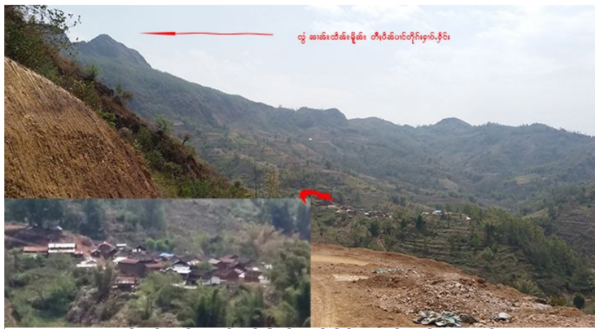
ဝါးခင်းဂပ်;ဂါင်.ကဆ်ဂါမ်းပိတ်;တင်းပိုင်း (ဝါးခင်းသင်းလှ်.ချူးဆ်)

မိုင်းလိဝ်မီးသိုင်းမာဆ်;သမ်တပ်. ပင်းသင်းယူ,လွမ်းဂိုမ်းဂွမ်းဝါးခင်းဂွင်း (ဂျူင်းသျှီးထူင်း)။ ဂါးဆမ်; သိုင်းမာဆ်; မီးမွင်း 150။ ဂူဆ်; ဝါးခင်းဒတ.တိုဆ်;တုးကမ်,ခွ်;မီးဟို.လှ်.ယူ,ဆ်;ဝါးခင်းယဝ်.။ ဂူလှ်;မီးဂူဆ်;လိ;မာင်ဂေ. မာင်ပွင်း ဂျူတင်းပွင်းမိုင်းဂျူဂိုတ်းဂို; ဆေးယူ,။