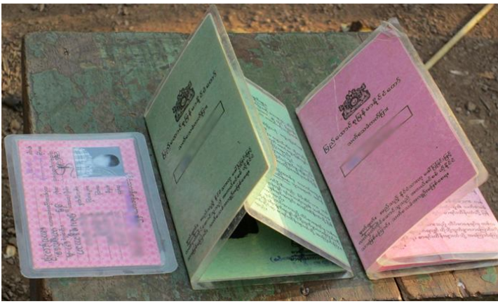
ဝှ်ဂးတူဝ်သမ်တူဝ်. တးလာဂ်းဂဂ်းဂါင်.

ခးကမ်,မီးဝှ်ဂးတူဝ် (မာတ်.ပုင်,တိခင်း,မာခင်း) တိမ်တိမ်ထုခင်းထုခင်းဂေ.ခိုင်း။ ခးမီးဝှ်သီခိပ် “ကဆ်မီးသမ်တူဝ်.” (ပီခင်းဝှ်ထတ်း ထွင်ဝှ်ဂးတူဝ်ဂှ်းမိုဝ်း)။ ဝှ်ဆဆ်.ကွဂ်,ပဆ်ခးမိုဝ်းဆုံးလိခင်းမေး 2009။ တီးစတု.မဆ်း ပေးစမးခး မီးဝှ်ဂးတူဝ် မိုဝ်းမာခင်းတိမ် တိမ်ထုခင်းထုခင်းယဝ်.စလး ခးဂေ.ထုဂ်,လံးဝှ်ဂးတူဝ်တိမ်တိမ် ထုခင်းထုခင်း ဂေ.ခိုင်းယု, ဂှ်းဂးလှ်းအးတီးခဝ် ကမ်,ကွဂ်, ပဆ်ခးတိမ်တိမ်ထုခင်းထုခင်း ကဆ်ပီခင်း လာဂ်းဂဂ်းဂါင်။ ဂှ်းခးအံ့.ကမ်,လံးလှ်းလှ်းပီခင်းသင်။ အံ့.ဂေ.ပီခင်းဝှ်ခင်းဝှ်လှ်း တင်း ကဆ်ပီခင်း ပာင်တိုဂ်းယု,မိုဝ်းလိပ်ဆဆ်.ယဝ်.။