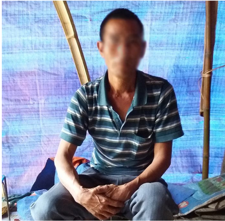
ဂူးခင်းဝါခင်းဂင်းဂင်.ဂေး.ကမ်ထုတ်,သိုင်းမာခင်းပေး.ထုပ်.

ဝါးဂွင်းခါးလိပ်ထုတ်,ပွဲ,တူဝ်ယပ်.ဂွင်းခင်း ဂူးခင်းဝါခင်း ထိုင်းဂေး. ခိုခင်းခင်းဝါခင်းဂွင်း လှိုင်းဂွင်း. လှိုင်းခါးလိပ်ခိ. ကာယု 39 လိပ်ထုတ်, သိုင်းမာခင်းတိလှိုင်း။ မခင်း လိပ် ထုတ်,တိလှိုင်း ဖွင်းပွန်းမိုဝ်းလှိုင်းသူခိဂို; ခါးမခင်း။ မခင်းလိပ်ထုတ်,တိလှိုင်းဂျူးမွှ်းခါးတင်း 10 ဝင်း။ မိုဝ်းမခင်းပွန်းမားလှိုင်းလိပ်ခိခိ. တင်းမိုင်းငခ, ခင်း. ခါးတျမခင်းပေးမာခင်း.လမ်. ဂျူးသိုင်းသေ တမ်. တိုဝ်. ပေးပီးလှိုင်းထိုင်။ မခင်း ယူ,ထိုင်; 3 ဝင်းသေ ဝါးခင်း.ဂိုလိပ် ဂျူးတင်းလှိုင်းဂေး,ကမ်,ဂျူးယပ်။