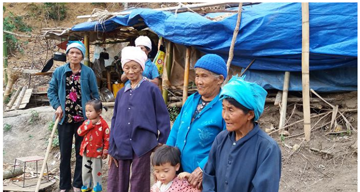
ဂူခင်းပံးပေးခပ်ဂင်.ဂမ်းခမ်ပီခင်းဟင်.ကာယုယု,ခလးလုဂ်းကွခမ်,

ခးကမ်,လံးမိုင်းလူးဝါခင်းခးမီးပီခိုင်းယပ်။ ခးကမ်, ဂုတ်း ပွဂ်းမိုင်း ဂွပ်းဝးဂူခင်းဝါခင်းကခဲယု,တီးခခခမ်.လံး ဂုလံးပိတ်း မိုင်းခင်း လိုခမ်မတ်.ချ ပူခမ်.မး။ မီးထပ်း ယိင်းဂေးခိုင်း ကာယု 90 ခလးလာခမ်.လံးမခင်း ဝါခင်း လာဝ်း လိဝ်း ဂေး.ကခဲကာယုလံး 20 ပီ။ ချသွင်ဂေး. ခခခမ်.လာခမ် ယု,ပံ.ဝံ.ပိုင်းတျ,လူလွမ်တုလင်းထိုင်ဂျီခင်း ဧယးခပ်. ဂူလင်းဂးကပ်ဂုလံးပိတ်း။ ကမ်,မီးဟင်လုဂ်. ဂျီ.လွမ်း ခပ်,ခါင်းလွင်းတင်းခပ်. ဂူလင်းဂးဂုမ်းခတ. ဝူခမ်. ဝးခပ်တိုခင်းလျးခး တံပိတ်းယပ်။