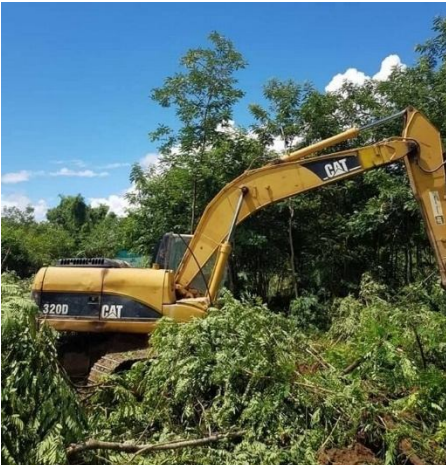
ကုမ္ပဏီမှ မြေနေရာများကို ဘူဒိုစေဖြင့် ဖျက်ဆီးနေစဉ်

လယ်သမားများက “မည်သူက မြေနေရာတွေ ရှင်းလင်းဖို့ စေခိုင်းသလဲ” သူတို့အားမေးမြန်းရာ ‘အထက်ကအရာရှိ အမိန့်အတိုင်း နာခံလုပ် ဆောင်သာဖြစ်ကြောင်း’ ပြန်ဖြေသည်။