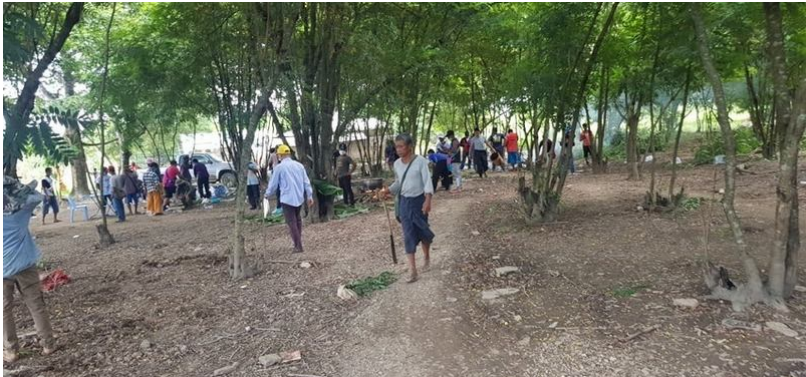
ရွာသားများတို့ပိုင်ဆိုင်သည့်မြေနေရာပေါ်တွင် ထမင်းစားနေကြတဲ့ ဝတပ်ဖွဲ့တို့အလုပ်သမားများကို တွေ့ရစဉ်

‘ဝ’ တပ်ဖွဲ့အလုပ်သမားများ စိုက်ခင်းသို့ ထပ်မံရောက်လာကာ နေ့စဉ်ရက်ဆက် ရှင်းလင်းနေလေသည်။ လယ်သမား ၄၅ ဦး တို့က တာချီလိတ်မြို့နယ်ရှိ ဌာနဆိုင်ရာ အစိုးရအုပ်ချုပ်ရေးမှူးများ (ကျေးရွာအုပ်စု၊ မြို့နယ်၊ ခရိုင်အဆင့် မြေယာဦးစီးဌာန နှင့် ဒေသဆိုင်ရာ ရဲစခန်း အပါအဝင်) ထံသို့ ဟုန်ပန်းကုမ္ပဏီ၏ မြေယာကျူးကျော်မှု လုပ်ရပ်ကို တိုင်တန်းစာပေးပို့ထားသည်။ အရေးယူပေးပါရန် တောင်းဆိုထားသော်လည်း ယခုချိန်ထိတော့ အ ကြောင်းပြန်ကြားခြင်း မရှိသေးပါ။