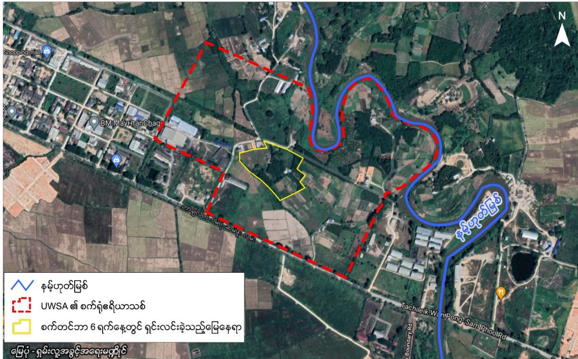
တာချီလိတ်မြို့အနီးရှိစက်ရုံများအတွက် UWSA မှ ၂၀၂၁ စက်တင်ဘာ ၆ ရက်နေ့တွင် လာရာက်ရှင်းလင်းခဲ့သည့်မြေနေရာ

ဒေသခံ လယ်သမားများ၏ အခွင့်အရေးကို ချိုးဖောက်မှု၊ ထိုင်း-မြန်မာ နှစ်ဖက်နိုင်ငံ ပတ်ဝန်းကျင်ညစ်ညမ်းမှု ဆိုင်ရာ ခြိမ်းခြောက်မှု ရှိနေလင့်ကစား အရာရှိများသည် 'ဝ' တပ်ဖွဲ့ဘက်သို့ လိုက်ပါရပ်တည်ပေးနေသည်ကိုမူ ထင်ရှားလှပေသည်။ ကျွန်တော်တို့ရှမ်းလူ့အခွင့်အရေးမဏ္ဍိုင်က ၎င်းစက်ရုံ တည်ဆောက်မှုစီမံချက်များအားလုံး ချက်ချင်း စွန့်လွှတ်ပြီး မြေယာများကို ပိုင်ဆိုင်သင့် ပိုင်ဆိုင်ထိုက်သူ/ပိုင်ရှင်အမှန်ဖြစ်သူများထံ ပြန်လည်ပေးအပ်ရန် ထပ်မံ တောင်းဆိုသည်။