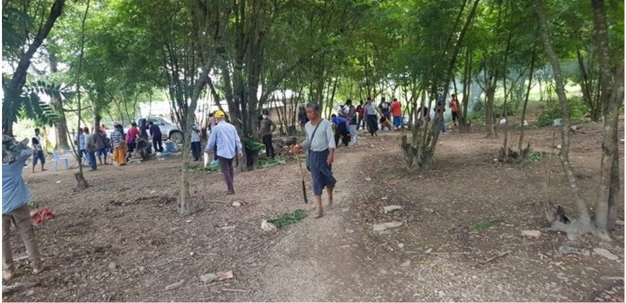
ဂူခင်းရှ်တီးဂါခင်သိုက်ဝ ခပ်တိုက်.ဂါခင်ခပ်ခင်းခင်းသူခင်ခိုင်တီးလိခင်ဂူခင်းဝါခင်း

လဝ်းရှ်ခး 45 ဂေ့.ကွခင်ဂခင်သိုင်,လိဂ်းထိုင်လဝ်းခးတီး လံာ်လံာ်ခံာ်,ခင်းတးဖီးလိဂ်း (ပးလိမ် လခင်. ကိုင်,၊ ငလးဝိင်း၊ ငလးတွခင်း၊ နံာ်,ကုပ်.ပိုင်,ဂူးလွင်းလွင်း၊ နံာ်,တီးလိခင်ငလး လဝ်းခး တီး/ ငယး) တာင်, လာတ်;ခခလွင်း;တင်းကခင်ခွမ်းပခင်းရှင်ပင်းခပ် နိုတ်.ရှိမ်ကပ်တီးလိခင် လိုဝ်းခင်.ယပ်. တုဂ်းယွခင်း ရှ်းလဝ်းခးတီးခပ် လွံးခိုင်ပွင်ပခင်။ ဂူလ်းဂးယင်းပံ,ရှခင်ခေးတုမ်.တွပ်, လွံးထိမ် သင်မး။