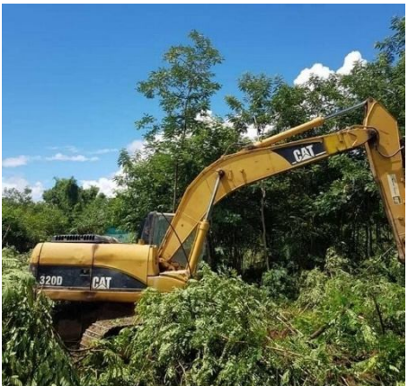
ရှိတ်. / ဂုးထုလှ်၊ ခွင်ခွမ်းပခင်းခပ် တိုက်. တီး ထုလှ်၊ ယု. တီးလိခင်ရှင်ခင်းဝါခင်း

ခင်းယမ်းမွက်၊ 9 မှင်းဂင်ခင် ရှင်ခင်းရှိတ်းဂါခင်ခွမ်းပခင်း ရှင်ပင်းခပ် 60 ပံ၊ ရှိ၊ ရှိ. / ဂုးမုးလုင်း တီး၊ လိခင် ရှင်ခင်း ဝါခင်းရှင်လှိုင်. ကန်မီးတင်းကွက်၊ တု၊ ခီးလိက်။ ခပ်ကပ်ရှိတ်. / ဂုးထုလှ်၊ မုးတေ၊ တီး၊ နီခင်းတီး၊ လိခင် ငလးတူခင်းမံ. ခီးလိက် (မွက်၊ လိ၊ လိ) တင်းခွင်း ရှိခင်း သူခင်း လင်းခင်း။ ရှင်ခင်းရှိတ်း ဂါခင်လှိုင်ခင်. ပုးတင်းမိတ်း တင်းမံ. မှိုင်ရှင်လွက်၊ ဝိုတ်း သင်ဝုးလင်းရှိခင်းခပ်မုးတု. ရှမ်းခပ်။ ရှင်ခင်း ရှိတ်းဂါခင် လှိုင် ခခင်. လါတ်းဂုမ်းဝ တေ၊ ဂါခင်သေ ခခင်ပိုင်ခင်းရှင်၊ မှိုင်ရှင်ခင်းသိုက်ဝ ကန်သိုက်ခင်း မှိုင်ရှင်ခင်း ခခင်. ယပ်။