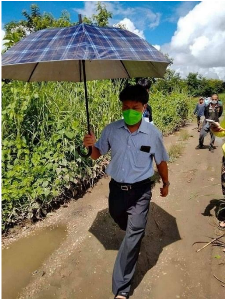
ခခီးခင်း

ဖွင်းဂင်ဝခင်းတိုင်ခခေ. ဂုခင်းဂေ့.ခိုင်;လိုင်;ရှင်. ခခီးခင်း လာတ်;ဂွမ်းခေ,ခွဲ;မိုခင်ပေးလိုင်. ဂုခင်း ရှ်းတီး ဂခင်လိုင်ခခေ.ခပ်; မးခင်းတီးလိခင်ယိပ်းတင်းမင်လေး; ကခင်မခင်းကပ်ခခေလဝ်းရှ်း လဝ်းအေးဝဲး ခခေ.ပိခင် ဖေ့ခင်လိဂ်းကခင်လံးခွင်. တီးလုင်ပွင် လိုင်; တု,မးသိုပ်,ရှ်းတီးခင်းဂခင် ခေ ယပ်.။ ဂုလ်းဂး ဖွင်း လဝ်း ရှ်းအေးခပ် လု/ကခင်,တုလ်းလိဂ်းခခေ. လံးရှ်းဝဲး လိဂ်း ခခေ. ပိခင် ဖေ့ခင်လိဂ်းကခင် ခွမ်း ပခီး ရှင်ခပင်ခခေ တင်,ထိုင် လုင် ပွင်လိုင်; ပိုဝ်းတု,ကပ်တီးလိခင်လှ်.တိုဝ်း လိမ် မိုဝ်းပီ 1999 ခခေ. ယပ်.။