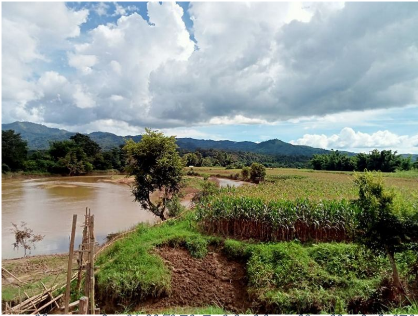
ကျောက်မီးသွေးတူးဖော်ရေးစီမံကိန်းကြီးဖြစ်မြောက်ဆိုမည်ပါက ပျက်စီးစေနိုင်သည့် နမ့်ပန်မြစ် တစ် လျှောက်ရှိ လယ်ယာမြေမြေနေရာများ