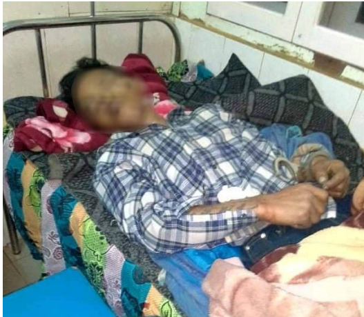
လုံးထုခင်းဝိခင်း

၀၇၊ လုံးထုခင်းဝိခင်းမာတ်၊လိပ်း ယွခင်း.ကပ်လူတ်.ခိုင်းလူမ်. ခခ်ခခင်း။ မခင်းခခင်းဂေး၊ ကမ်,ယွမ်း လူင်း လုံးမိုင်းပခင်း သေ တင်းပီးခွင်.မခင်းလုံးလင်,လူင်းဂခင်းဂျးတီးရှင်းယျ။