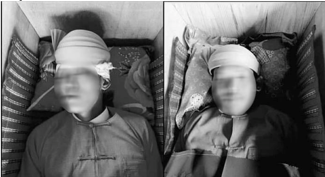
ခပ်းတိုင်တံး လုံးလမ်း,လျး.ခလး;လုံးသိုင်ရှာခမ်

လက်,မက်,တိုင်.ဂျားကူက်၊ ပိမ်.၊ ချခလးမိုင်းလုံးလမ်း,လျး.သေ လုံးသိုင်ရှာခမ်ခေ့. ဂျားတိုင်.သ့, တီးပုမ်၊ ရှင်ခလး;ခိခမ်လိုင်ခေ့.။ ဂျားခပ်ဂေ့ပိခမ်းဂုင်.လွမ်းခင်းတင်းခေမ်.။ သိုက်မခမ်းတံးခွ်း ပာင်တိုက်ကမ်, ယွမ်းသိပ်းဂေ့.။