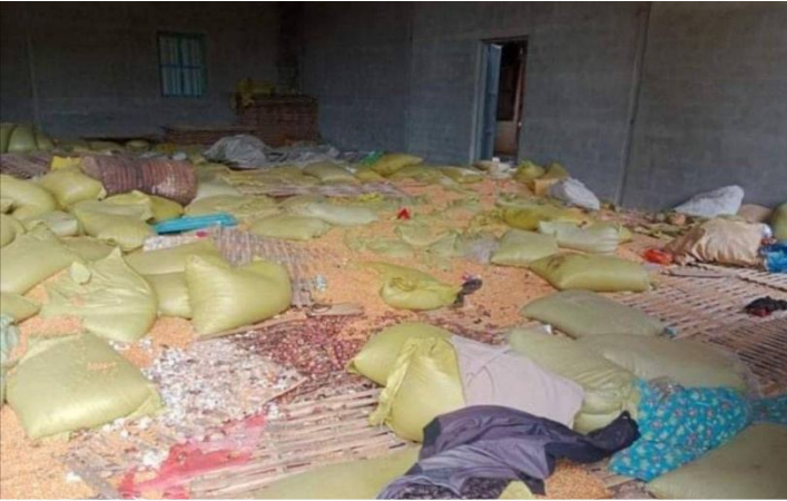
လွယ်ပေါကျေးရွာတွင်စစ်ကောင်စီတပ်မှ လုယက်မေ့နှောက်ခံရသောအိမ်

ဇွန်လ၃ရက်နေ့တွင် စစ်ကောင်စီတပ်သားများသည် လဟယ်ကျေးရွာသို့ ရောက်ရှိလာကာ လဟယ်ကျေးရွာရှိ နေအိမ်အလုံး ၂၀ကိုမီးရှို့ခဲ့သည်။တစ်ချိန်တည်းမှာပင် ပိန္နဲကုန်းကျေးရွာအုပ်စုမှ နေအိမ်အများအပြားသည်လည်း မီးရှို့ဖျက်ဆီးခံခဲ့ရသည်။