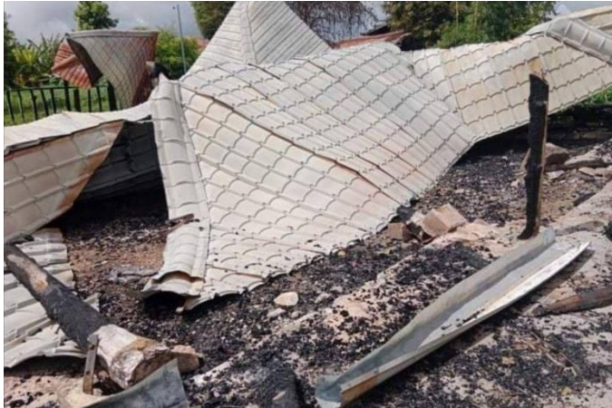
ဆောင်နန်းခဲကျေးရွာတွင်စစ်ကောင်စီမှမီးရှို့သောအိမ်

ဇွန်လ ၂၁ ရက်နေ့တွင် နန်းပေါ်လုံကျေးရွာတွင်စခန်းချ နေ ထိုင်သော စစ်ကောင်စီ တပ်သားများ သည် နန်းပေါ်လုံကျေး ရွာအတွင်းရှိ နေအိမ်၃လုံးမှဆိုင်ကယ်၊ ဓာတ်မြေဩဇာနှင့်ထွန်စက်များကို လုယက်ခိုးယူပြီး နောက် နေအိမ်များကိုမီးရှို့ဖျက်ဆီးခဲ့ကြသည်။