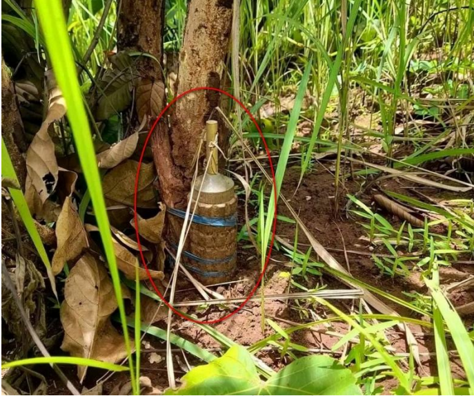
လွယ်မကူးတောင်ခြေတွင်စစ်ကောင်စီထောင်ထားသော မြေမြှုပ်ခိုင်း

စစ်ကောင်စီတပ်သားများသည် လွယ်ပေါကျေး ရွာအုပ်စုအတွင်း ဆက်လက်စခန်းချနေထိုင် လျက် ရှိရာဒေသခံ ပြည်သူများအနေဖြင့်အိမ် ပြန်ရန် ကြောက် ရွံ့နေကြသည်။ စစ်ကောင်စီတပ် သား များသည် ၎င်းတို့ မွေနှောက် လုယက်ထား သော နေအိမ် များတွင်စခန်းချနေထိုင်ကြပြီးကျေး ရွာပတ် လည်တွင်မြေမြှုပ်ခိုင်းများ ထောင်ထားခြင်း ၊လွယ် မကူး တောင်ပေါ်မှနေ၍လမ်းမကြီး ပေါ်တွင် သွား လာသော ပြည်သူများကိုရမ်းသန်း ပစ်ခတ်ခြင်း များ ပြုလုပ်ကြသဖြင့်လမ်းမကြီးကို အသုံးပြု ရန် ကြောက်ရွံ့နေကြသည်။