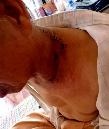
လင်းသူလ်,ထုခင်း

သိုက်;မခင်း;သမ်ဂေး.ခခပ်.ကွက်,တပ်.ခပ်မေးသေ ထမ် လင်း သူလ်, ထုခင်းဝ; “ခခပ်.ဝိခပ်ဝှပ်;သူဂူး?” ဗွင်းလင်းသူလ်, ထုခင်း တွပ်,ဝ; “လုံးကေး” ခခပ်ခခပ်. သိုက်;မခင်း;သမ်ဂေး. ခခပ်.လုံး.လင်းသူလ်, ထုခင်းခပ်.ခပ်.လင်း။ လင်းသူလ်,ထုခင်း ကပ်, ရှိတ်း လွမ်း ဂွမ်းခပ်သေ သိုက်;မခင်း;သမ်ဂေး.ခခပ်.မေး လွမ်း. တှပ်လင်းသူလ်,ထုခင်းယပ်. ကပ်တုမိုဝ်းထုပ်. သူခင်းခွင်; တွံ, မခင်း။ သိုက်;မခင်း;ဂေး.ခိုင်; ကပ်မိတ်;ခင်း ပိမ်း လင်းသူလ်, ထုခင်း ခခပ်.မေးပတ်,/ထိုဝ်ခေး လင်းသူလ်,ထုခင်း ထိင်းယူ, ယပ်.။ ဗွင်းခခပ်.ဂူခင်း ဝခင်း;မွက်;ဂူးဂေး. ရှိမ်းခခပ်.ဂခပ်သေ ကင်း;မေးလုံးလင်းသူလ်,ထုခင်း။ သိုက်;မခင်း;ခပ်ဂေး;ကပ်ခွင်; ယိုဝ်း ခိုခင်း;ဗွ.သေခပ်;ဂူး, ခင်းတပ်.ခပ်ခိုခင်း။