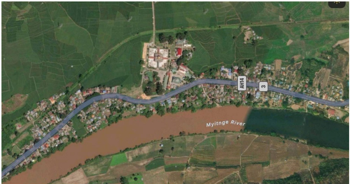
သမိုင်းဝင်ဘော်ကြိုဘုရားနှင့် နမ္မတူမြစ်ကမ်းဘေးတွင်နီးကပ်စွာနေထိုင်သော ဘော်ကြိုရွာ

ထိုကျေးရွာအုပ်စုထဲတွင်ပါဝင်သည့် ဒုဌာပတီမြစ်ကမ်းဘေးရှိ ဘော်ကြိုကျေးရွာအုပ်စုမှ ဘော် ကြိုရွာ သည် သမိုင်းဝင်ဘော်ကြိုဘုရားကြီးအပါအဝင် အခြားသမိုင်းဝင်အမွေအနှစ်များ ကြောင့် ကျော်ကြား သည်။ အထက်ရဲရွာရေအားလျှပ်စစ်စီမံကိန်း တည်ဆောက်ပြီးစီးခဲ့ပါက အဆိုပါ သမိုင်းအမွေအနှစ်များ သည် ရေအောက်သို့ပျောက်ကွယ်သွားနိုင်သည့် အန္တရာယ်ရှိနေ ပြီဖြစ်သည်။