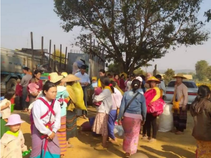
ဟိုခိုကျေးရွာသို့ထွက်ပြေးတိမ်းရှောင်လာသောဒေသခံများ

တစ်ဦးက PDF နှင့်ပတ်သက်သည်ကိုတွေ့ပါက ရွာကိုမီးရှို့ပစ်မည်ဟု ခြိမ်းခြောက် ခဲ့ပြီး ဟိုခိုကျေးရွာ တွင်ထွက် ပြေးတိမ်းရှောင်နေသော ရွာသားများကို ပြန်မလာပါကလည်း တစ်ရွာလုံးကို မီး ရှို့ပစ်မည်ဟု မှာကြားစေခဲ့သည်။ ထို့ကြောင့် ရွာသားများအားလုံးသည် ဖေဖော်ဝါရီ ၁၄ ရက်နေ့တွင် ပြန် လာခဲ့ရသည်။