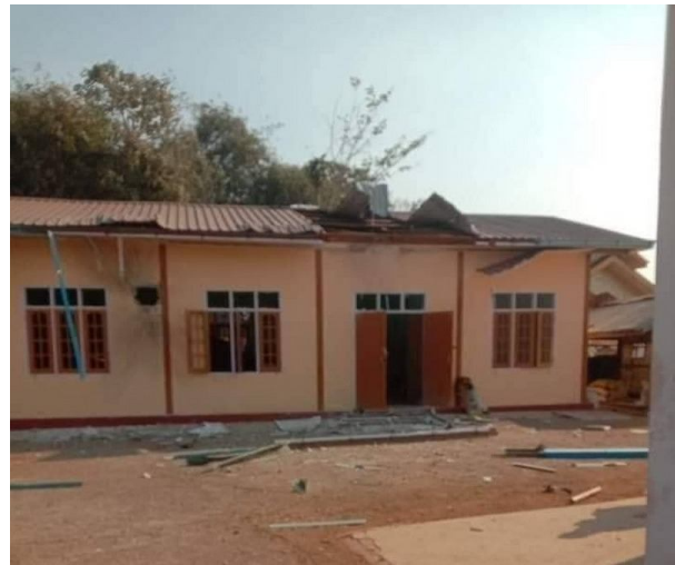
စစ်ကောင်စီ၏လေကြောင်းတိုက်ခိုက်မှုကြောင့်ထိခိုက်ပျက်စီးသောဘုန်းကြီးကျောင်းအဆောက်အအုံ

ဖေဖော်ဝါရီလ ၁၀ ရက်နေ့တွင် စကခ ၁ လက်အောက်ခံ ခမရ ၅၀၂ နှင့် ခမရ ၅၀၅ မှ စစ်ကောင်စီ တပ်သား တစ်ရာခန့်သည် တောင်ဘက်မှနေ၍ ပြင်ဦးလွင်-မိုးကုတ်လမ်းအတိုင်း လုံခံ ကျေးရွာသို့ ချဉ်းကပ်လာခဲ့သည်။ ရွာ၏ အရှေ့ဘက်သို့ အရောက်တွင် အဆိုပါဒေသ၌ လှုပ်ရှားနေသော မန္တလေးပြည်သူ့ ကာကွယ်ရေးတပ်ဖွဲ့ဝင်များနှင့်ထိတွေ့တိုက်ပွဲများ စတင်ဖြစ်ပွားခဲ့သည်။