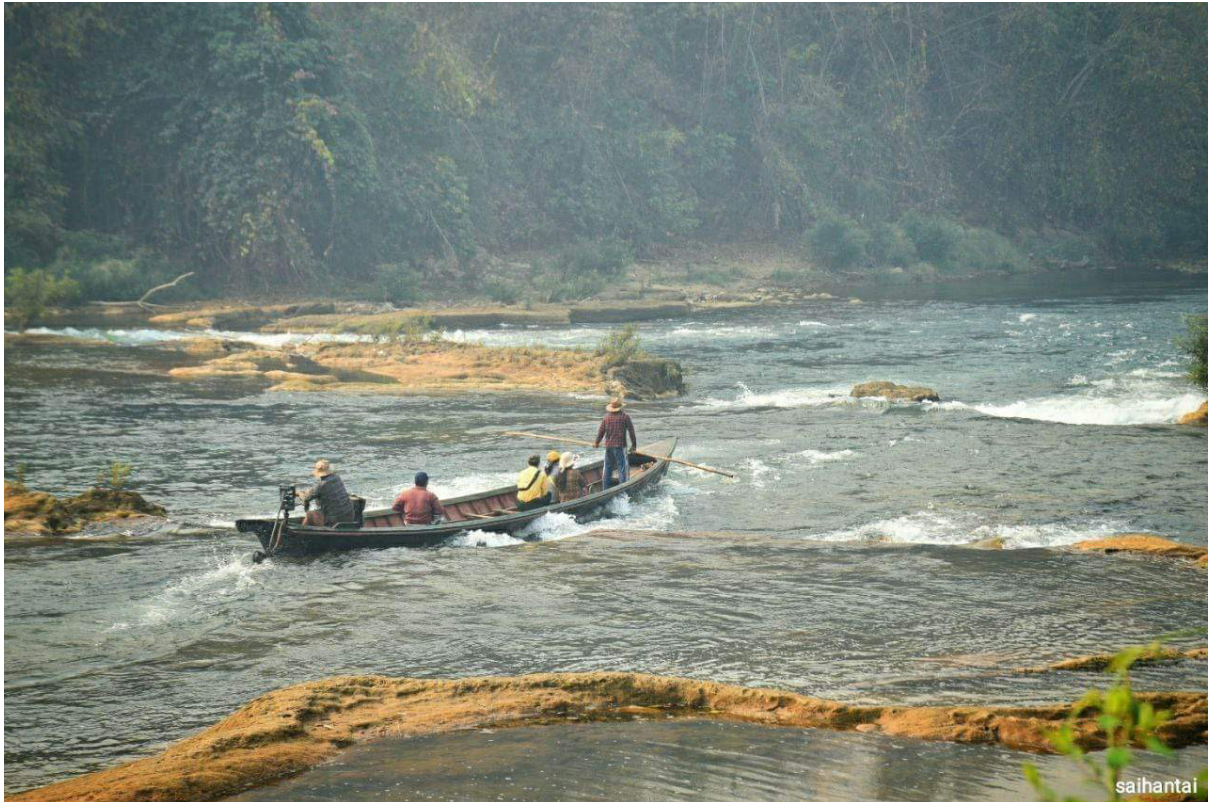
ဓမ္မစာမိတ်တို့

ကောင်စီ၊ နှစ်ပတ်စပတ်၊ ဗဟိုဂိုဏ်း၊ ဓမ္မစာမိတ်တို့၊ တွင်းခွက်၊ ဓမ္မစာမိတ်တို့၊ ဓမ္မစာမိတ်တို့၊ ၁၁ ကောင်စီ၊ ဓမ္မစာမိတ်တို့၊ ဓမ္မစာမိတ်တို့၊ ဓမ္မစာမိတ်တို့၊ ဓမ္မစာမိတ်တို့၊ ဓမ္မစာမိတ်တို့၊ ဓမ္မစာမိတ်တို့၊ ဓမ္မစာမိတ်တို့၊ ဓမ္မစာမိတ်တို့၊ ၁၁ ကောင်စီ၊ ဓမ္မစာမိတ်တို့၊ ဓမ္မစာမိတ်တို့၊