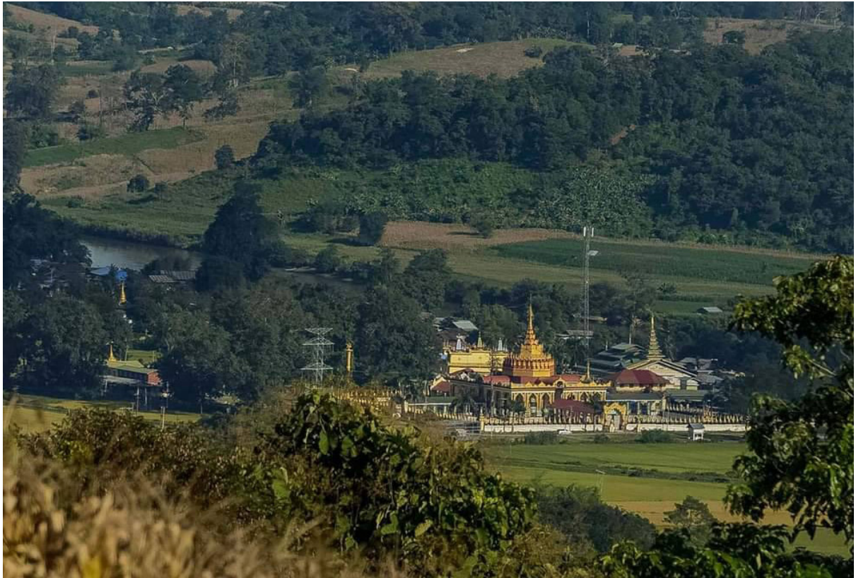
၎င်းမူးရိုက်ပိုင်းပေးဂျူင်၊ရှမ်းမေးခမ်းတူး

ခင်းကိုင်း၊ဝါခင်း 11 ကိုင်း၊ခခင်းခင်းပူး ကိုင်း၊ပေးဂျူင်၊ ကိုင်း၊ခမ်းသိမ်၊ ကိုင်း၊ခမ်းကုခင်း၊ ကိုင်း၊ခေးမာန်၊ ခေး၊ ကိုင်း၊ခမ်းလခင်း၊ ကိုင်း၊လခင်းခင်း၊ ကိုင်း၊ဂုခင်းသေး၊ ကိုင်း၊မခင်းမွခင်း/ မခင်းဂျင်း၊ ကိုင်း၊ရှပ်ခါး၊ ငလး၊ ဂွင်းခမ်း လိုင်းခမ်း။