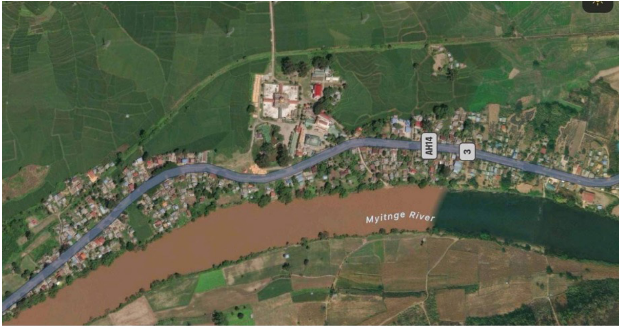
บ้านบ่อเกลือ ที่อยู่ริมฝั่งแม่น้ำตู่และพระราชอุทยานที่อยู่คู่บ้านเมือง

นับแต่มีการทำรัฐประหาร การก่อสร้างเขื่อนน้ำตู่ขนาด 210 เมกะวัตต์ได้เริ่มต้นขึ้นเช่นกัน โดยตั้งอยู่ 13 ไมล์ด้านเหนือน้ำจากเมืองสีป้อในบริเวณตำบลท่าแต ผู้พัฒนาโครงการนี้คือบริษัท Natural Current Energy Hydropower จำกัด ซึ่งได้รับการสนับสนุนจากประเทศจีน และเขื่อนแห่งนี้จะทำให้เกิดน้ำท่วมที่บ้านหลี่ลู ซึ่งประชากรส่วนใหญ่เป็นคนเชื้อสายไทยใหญ่