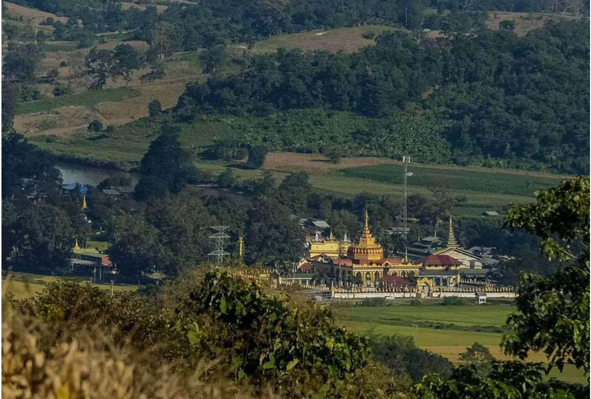
พระธาตูป่อเกลือริมฝั่งแม่น้ำตู่

อย่างไรก็ดี นับแต่มีการตั้งคณะกรรมการเมื่อเดือนธันวาคม ชุมชนในพื้นที่ยังไม่ได้รับข้อมูลเพิ่มเติมว่าน้ำจะท่วมพื้นที่ส่วนใดบ้าง