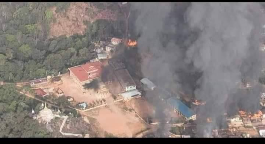
ရှိုခင်းဂူဆင်းဝါဆဲ;ဆမ်.ခီင်; ကဆဲသိုဂ်းမါဆဲ;ကပ်ဖုံးဖေဂ်

မိုင်းဝါဆဲ;ထိ 11/3/2023 ဂါင်ခွဲ သိုဂ်းမါဆဲ;ကဆဲယူ,တီးဂုင်းကြေးခေခေ. ယိုဝ်းမါဂ်,လူင်ခပ်ဂျးဂူဂူ; ဂူ; တါင်းသေ ဗိုမ်.ထိမ်ကီခင်ဂိုင်းသိုဂ်းခပ်;ခွဲဝါဆဲ;ဆမ်.ခီင်;ထီင်;။ ဝါးခေခေ. သိုဂ်းမါဆဲ;တပ်.လုမ်းလူင် 66 ငလ; ဗမယ 518 ဂွင်.ကပ်သင်ချ,သမ်ပုးငလ;ဂူဆင်းဝါဆဲ; 18 ဂျေ.လှိုဝ်းတိုဂ်.ပိုင်းရှမ်း;ပံးဖေသိုဂ်းယူ,တီးတိုဂ်းခွဲ;ဝတ်./ရွှင်း ဆမ်. ခီင်;ခေခေ.ကွဂ်,မုးသေ ယိုဝ်းတံပိတ်;တင်းမူတ်း။ ဝါးသေချ;တံသင်ချ, ငလ;ဂူဆင်းဝါဆဲ;ယပ်. သိုဂ်းမါဆဲ;ထံ, ကပ် ခိပ်းရှင်;တူပ်တံသင်,ချ,ငလ;ဂူဆင်းဝါဆဲ;လှိုဝ်းခေခေ.သေ တါင်,ခိုဝ်ကွဆဲးလံးဝါး ဗပ်လံးချွန်ဂူဆင်း PDF ခံ ယပ်.။