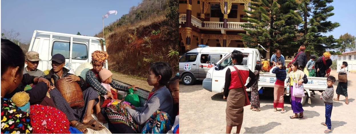
ဂူခင်းဝါခင်း၊ခမ်း.ခင်၊လေး၊ဝါခင်း၊ရှိုမ်းရှမ်း၊ လှုပ်၊ဂခင်ပံးဖေးရှုပိုင်၊ရှမ်း၊ခင်းပင်ပင်လွင်း

ကုန် ဂခင်ပွဲ၊ပိတ်၊ရှိုခင်းယေးသေ ပံးဖေးသိုက်သေ၊ ရှမ်း၊ လွမ်းပင်သင်းဂူခင်းပံးဖေးလှုပ်၊ခင်း ခင်းပင်ပင်လွင်း။ မီးဂူခင်းဝါခင်း၊ဂမ်းက၊ဂူလှ်းယူ၊ပံ့. ပွဲ.လူ လွမ်းပင်ခင်းဝါခင်း။