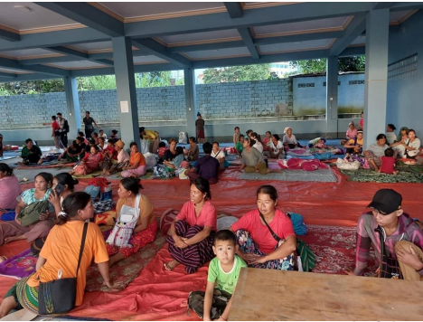
ဂူခင်းဝခင်းပံး;ဗေးမၢဂ်,လုင်လေး;ပၢင်တိုင်း

ယွခင်း.ပၢင်တိုင်းသေဂူခင်းဝခင်း; ဝခင်း;ဗံးမၢဂ်; ဗံး,ရွှင်း ကိုင်း,လေးလၢခင်း.လေး; ဝခင်း;မၢခင်းဂၢခင်း ဝခင်း; ခခေင်.ဂတ်းလေး; ဝခင်း; ခခေင်.ဂူခင်း ခင်းကိုင်း,ခခေင်.ဂတ်း ဂူဝ်ဂူခင်းမွှ်း; 2,000 လံး; ကွခင်း ဂခင်းပံး;ဗေး ပိုင်းဂူခင်း; ယု,တီးပွဂ်.လွမ်းလေး,လေး; ဂူခင်းရှေးဂုမ်းပွဂ်.ဂူဝ်ခေးခင်း ဝိုင်းခခေင်.ခမ်းလေးလွမ်းလံးလံးဝခင်း; ခင်းလေး; ဝိုင်းခခေင်.ခမ်း လိုင်း;တံးပွတ်းဂူခင်း,။