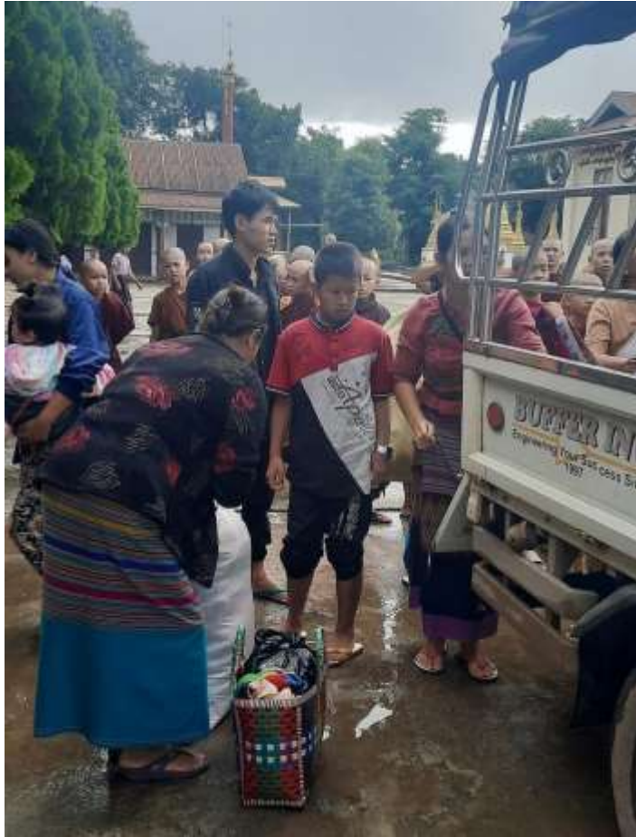
ရှုခမ်းပန်းပေးပေးကမ်းမားပိုင်;ကိုင်တီးဝတ်,ရွှင်းခမ်းမ