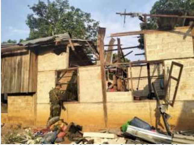
ရှိုခင်းဂူခင်းဝါခင်း;သမ်သိုဝ်ကခင်းဂုးမာဂ်,လူင်သိုဂ်းမာခင်းယိုဝ်း

မိုဝ်းဝခင်းထိ 15/5/2024 ခာဝ်းယာမ်းမွဂ်; 10 မူင်းဂါင် ခမ်း; ကမ်,မီးပာင်တိုဂ်းသင်သေ သိုဂ်းမာခင်း; ကခင်း ပဂ်းယူ,တီးဂိုမ်းဝါခင်းပာင်ပွံး (ပာခင်း.ပူလ်း) ခခင်း. ကပ် မာဂ်,လူင်ခပ်ယိုဝ်းခပ်;ဂျ,ခင်းဝါခင်း; သမ်သိုဝ် သမ်ဂမ်း။ မာဂ်,လူင်တူဂ်းခင်းဝါခင်း; သေ ဂိုတ်းရှိုခင်းဂူခင်း ဝါခင်း; 7 ဂေ့.မာတ်,လိပ်းလေး; ရှိုခင်းဂူခင်းဝါခင်းမွဂ်; 10 လင်လု ခွံပုး။