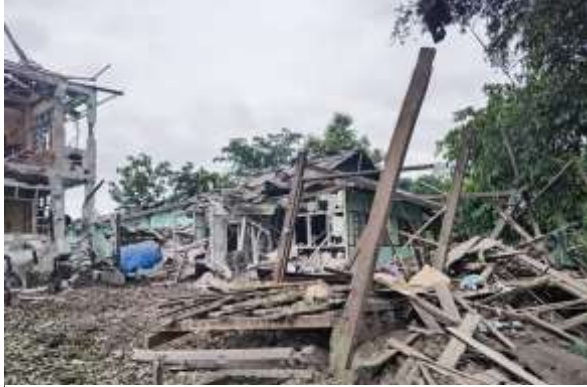
စစ်ကောင်စီလေကြောင်းတိုက်ခိုက်မှုကြောင့်ပျက်စီးသွားသော ကျောင်းအဆောက်အအုံ