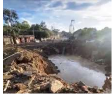
စစ်ကောင်စီဖုံးကြောင့်ဖြစ်ပေါ်လာသော ရောမတွင်း ပေါက်ကြီး

သိန္နိမြို့နယ်အတွင်းအရပ်သားများကိုထိခိုက်သေဆုံးစေသောလေကြောင်းတိုက်ခိုက်မှု (ဇူလိုင် ၃-၂၈, ၂၀၂၄)