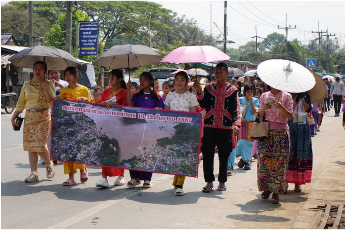
2024 စက်တင်ဘာလတွင် နမ့်ခတ်မြစ်ရေကြီးမှုကို ပြသသည့် ပိုစတာကို ကိုင်ထားသည့် ဒေသခံပြည်သူ