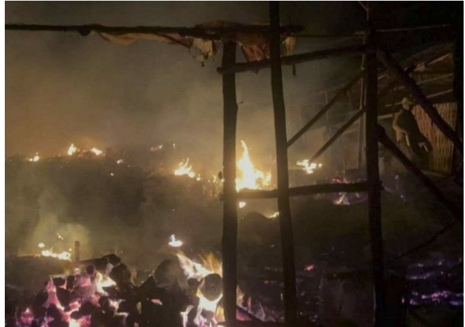
စစ်ကောင်စီ၏လေကြောင်းတိုက်ခိုက်မှုကြောင့် ပျက်စီးသွားသောမိုးကုတ်မြို့ရှိနေအိမ်များ

စစ်ကောင်စီ၏ လေကြောင်းတိုက်ခိုက်မှုများသည် နောင် ချိုမြို့နယ်တွင် အများဆုံးဖြစ်ပွားခဲ့ပြီး မိုးမိတ် နှင့် မိုးကုတ်မြို့နယ်ရှိ သတ္တုတူးဖော်ရာဒေသ များကို ပစ်မှတ်ထားသော လေကြောင်းတိုက်ခိုက်မှု ၂ကြိမ် ရှိခဲ့သည်။ ဖေဖော်ဝါရီလ ၁၀ ရက် နံနက် ၁နာရီတွင် စစ်ကောင်စီက မိုးကုတ်မြို့ အနောက်မြောက်ဖက် ၃ကီလိုမီတာ အကွာ တွင်ရှိသော ကျောက်တွင်းကို Y-12 ဂျက်ဖိုက်တာ လေယာဉ်ဖြင့် ဗုံးအလုံး ၂၀ကျော် ကြဲချခဲ့သဖြင့် အရပ်သား ၅ ဦးသေဆုံးပြီး အခြား ၂၀ဦးဒဏ်ရာရရှိခဲ့သည်။ ဖေဖော်ဝါရီလ ၂၀ ရက်နေ့ည ၈ နာရီတွင် စစ်ကောင်စီက မိုးမိတ် မြို့အနီး ပဲပေါင်း ကျေးရွာရှိ ရွှေတွင်းကို ဂျက်ဖိုက်တာလေယာဉ်ဖြင့်ပေါင် ၅၀၀ ဗုံး ၁ လုံးကြဲချခဲ့သဖြင့် ကျေးရွာသား ၃ ဦးသေဆုံးပြီး ၇ ဦးဒဏ်ရာရရှိကာ နေအိမ် ၁၀ လုံးနှင့် ကျောင်း ၁ ကျောင်း ထိခိုက်ပျက်စီးခဲ့သည်။