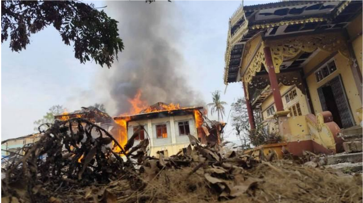
တရုတ်ပိုက်လိုင်းအနီးရှိ အုမ္မသီးကျေးရွာဘုန်းကြီးကျောင်းကို စစ်ကောင်စီမှ ဒရုန်းဖြင့်တိုက်ခိုက်မှု

စစ်ကောင်စီက ဖေဖော်ဝါရီလလယ်တွင် နောင်ချိုမြို့နယ်တောင်ပိုင်း တောင်းခမ်းအနီးရှိ ၎င်းတို့၏စခန်း များကို ပြန်လည်ထိန်းချုပ်နိုင်ရန် ထိုဒေသကို အပြင်းထန်ဆုံးသော လေကြောင်းတိုက်ခိုက်မှုများ ပြုလုပ် ခဲ့ပြီး ကူမင်းတွင် တရုတ်ဦးဆောင်ပြီး TNLA နှင့် စစ်ကောင်စီ တွေ့ဆုံဆွေးနွေးမှု ပြုလုပ်နေသည့် အချိန်မှာ ပင် တိုက်ခိုက်မှုများ ပြုလုပ်ခဲ့သည်။ တွေ့ဆုံဆွေးနွေးမှုသည် ရလဒ်မထွက်ပဲ ပြီးဆုံးခဲ့ပြီးနောက် ရက် အနည်းငယ်အကြာ ဖေဖော်ဝါရီ ၁၉ ရက်နေ့တွင် စစ်ကောင်စီက နောင်ချိုမြို့ကို ဗုံးကြဲခဲ့သဖြင့် ဆေးရုံ ၁ရုံထိခိုက်ပျက်စီးပြီး အရပ်သား ၃ ဦးသေဆုံးကာ အခြား ၄ ဦး ဒဏ်ရာရရှိခဲ့သည်။